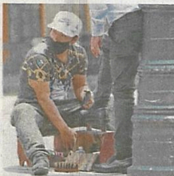
Trabajadores regresaron a las calles con medidas sanitarias.

Se registraron durante el primer trimestre de este año en la Ciudad