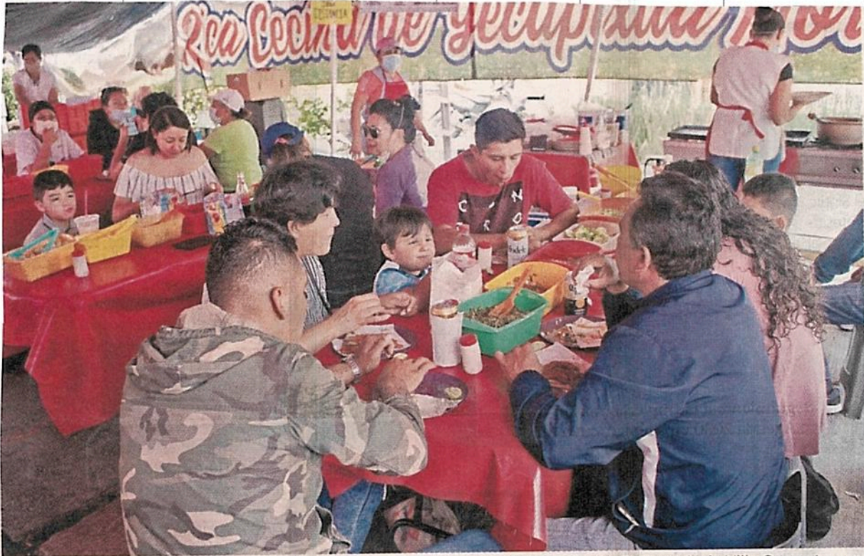
■ Los puestos de comida tenían mesa llena y los comensales no paraban de llegar. El tianguis de Villa Coapa tuvo ayer gran afluencia.