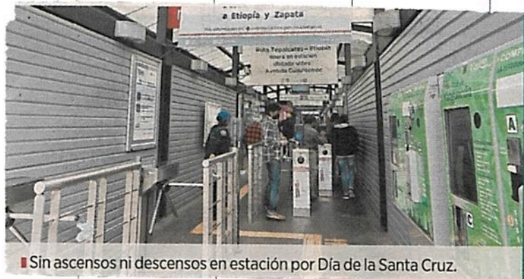
■ Sin ascensos ni descensos en estación por Día de la Santa Cruz.

El organismo pidió a los usuarios prever este cierre dentro de sus tiempos de viaje y contemplar rutas alternas.