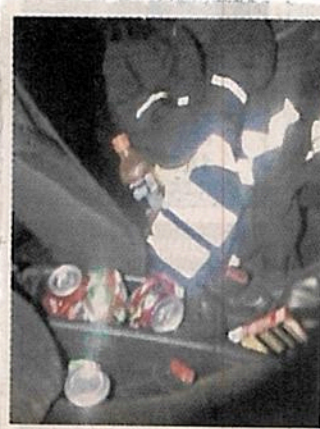
En el automóvil también encontraron ropa policial.

Los tres agentes fueron puestos a disposición de la autoridad y la Secretaría de Seguridad Ciudadana informó que la Dirección de Asuntos Internos ya abrió una investigación al respecto.