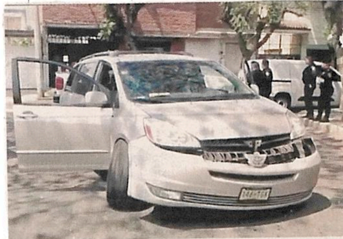
El sospechoso fue detenido por una infracción de tránsito.