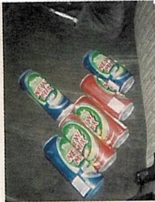
Los agentes bebían en un auto particular, en Milpa Alta.