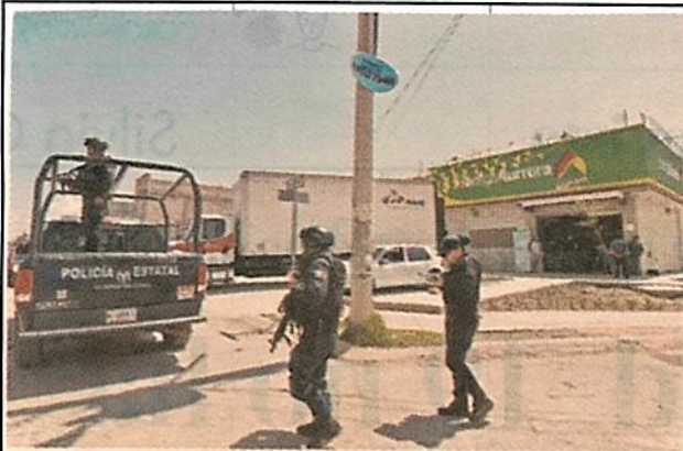
Policías estatales realizan monitoreos y patrullajes para inhibir los saqueos.