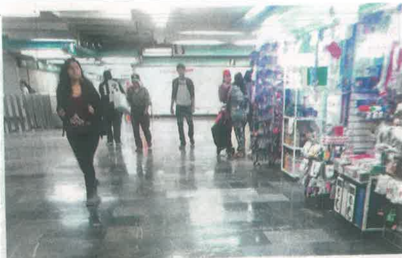
Los comercios tienen clientela segura /ROBERTO HERNÁNDEZ

La vigencia de los permisos fue de cinco años, uno fue del 10 de diciembre de 2010 al 9 de diciembre de 2015 y el otro fue