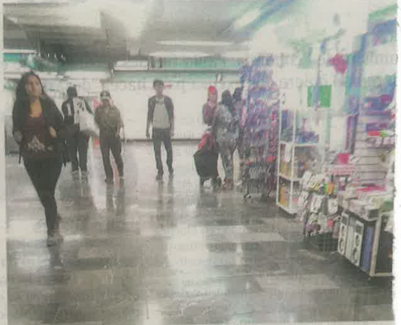
Los comercios tienen clientela segura