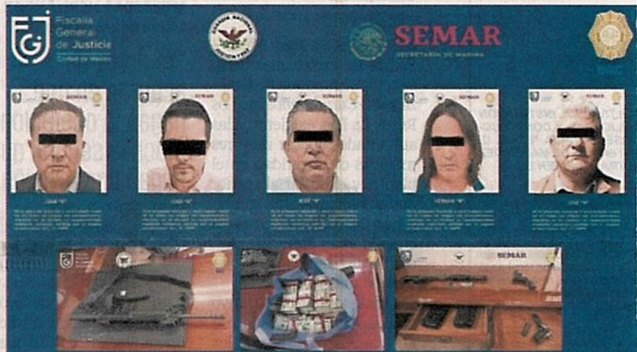
En el cateo en el que detuvieron a los cinco implicados encontraron efectivo y armas.

Esta casa editorial buscó a los abogados del caso, quienes