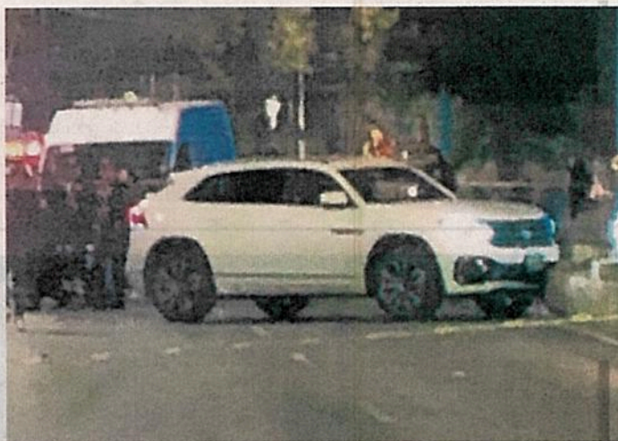
Los dueños de Dolls Drinks fueron asesinados en su camioneta por un hombre que huyó en una moto hacia la zona de Martín Carrera.