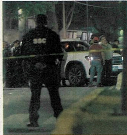
Esta es la camioneta donde viajaban