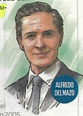
ALFREDO DEL MAZO

Históricamente, la mayor votación en el Edomex se dio en 2011, cuando Eruviel Ávila ganó con poco más de 3 millones de votos; en 2017, Del Mazo , con 2 millones; y antes, en 2005, Enrique Peña con 1.8 millones.