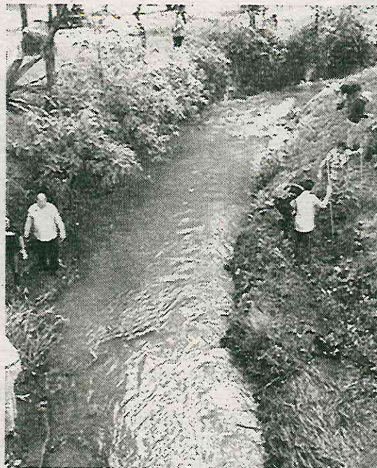
Hacen uso político de asentamientos irregulares

En tanto, el Instituto de Planeación Democrática y Prospectiva (IPDP) estimó que cada año, en promedio, 5 mil perso-