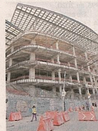
Los habitantes señalan que sólo se beneficia a Mítikah.