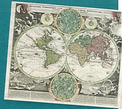
TYPUS Orbis Universalis, de Sebastian Münster.

"La muestra nos permite una nueva mirada a los acervos ricos y