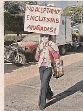
El bloqueo se realizó ayer en Avenida Universidad.

REFORMA solicitó una postura o información al respecto a Mítikah, pero hasta el cierre de edición no fue proporcionada.