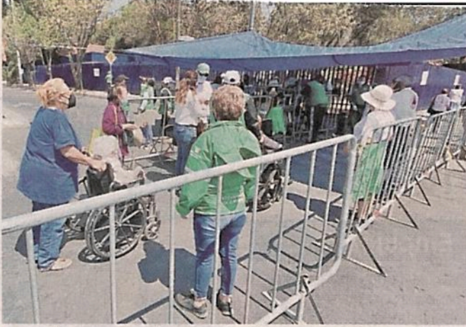
Tan sólo ayer se registraron 15 mil 191 personas vacunadas en tres demarcaciones.