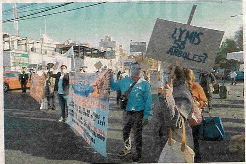
Los vecinos cerraron Avenida Universidad, frente a Mitikah