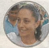
CLAUDIA SHEINBAUM JEFA DE GOBIERNO

No va a ser con el calendario de las alcaldías, sino un calendario especial para todo el Sistema Penitenciario"