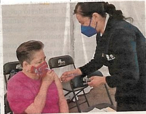
ORDEN. La vacunación avanza en Tláhuac, Xochimilco e Iztacalco.