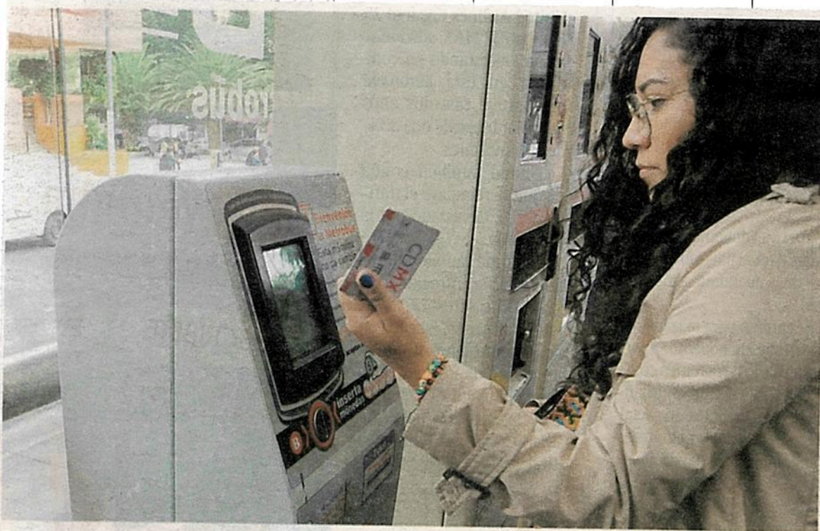
Se renovarán las máquinas, torniquetes y sistema de recargo de las tres primeras líneas para dar paso a esta nueva modalidad de cobro

3 LÍNEAS aceptarán esta modalidad, empezando con la 2