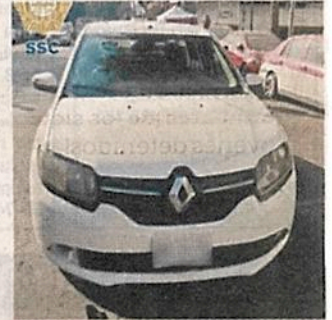
Indagan si el auto de uno de los sujetos es el del video.

El otro hombre relacionado con el crimen, es un joven de 20 años, aprehendido en la Alcaldía Gustavo A. Madero el 30 de enero, en la Colonia Mártires de Río Blanco como parte del seguimiento del feminicidio señalado.