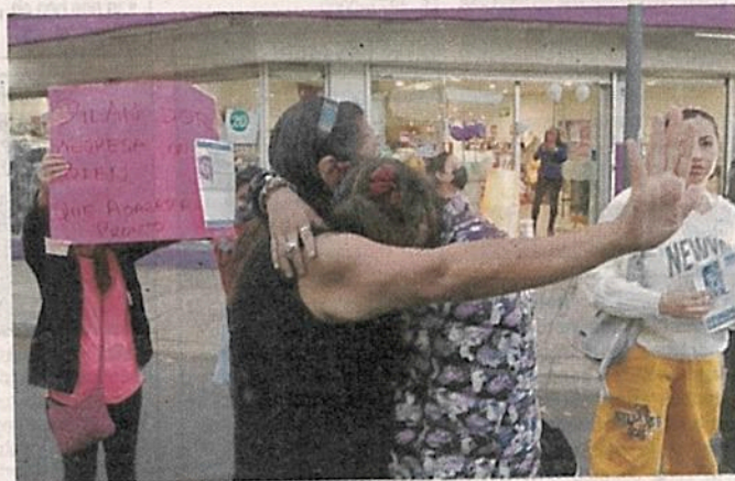
■ El adolescente desapareció el lunes, luego de salir de su casa para ir a la Secundaria Anexa a la Normal, explicó su familia.

Desde esa noche, presentó la denuncia por la desaparición ante la Fiscalía Gene-