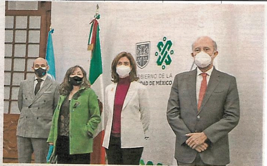
La secretaria de las Mujeres, Ingrid Gómez Saracibar, destacó que para apoyar a mujeres en situación de alto riesgo se desarrolló la iniciativa Covid-19, Seguras en Casa

Este programa también comprendió el fortalecimiento de las 27 Lunas al incluir un protocolo de atención telefónica y virtual a fin de brindar atención a mujeres y niñas en situación de violencia durante la pandemia.