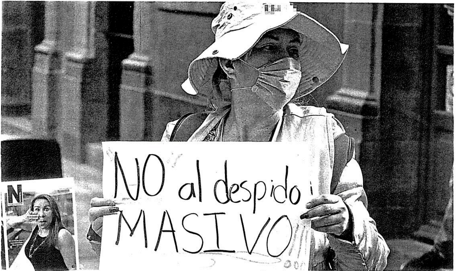
Durante la pandemia, se han manifestado contra despidos.

AUMENTA DESEMPLEO PARA ELLAS EN CDMX; LLEGA AL 48% DURANTE PANDEMIA: SEMUJERES PÁG. 7