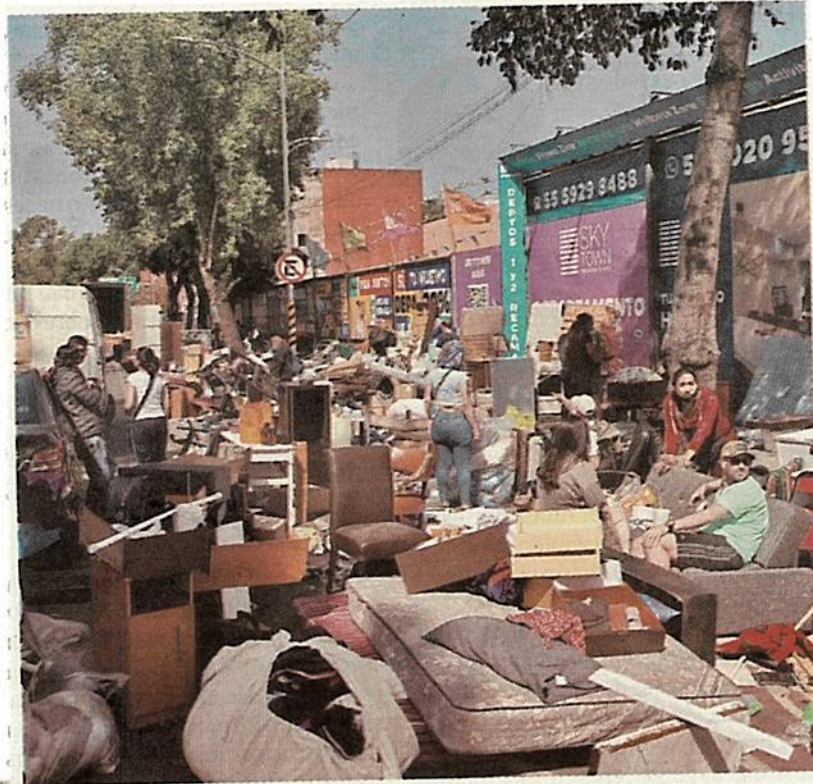
La Merced e Insurgentes Norte.