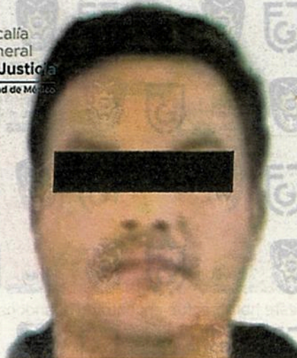
Carlos "N" el ex jefe de sector de la Secretaría de Seguridad Ciudadana

El impartidor de justicia ratificó la medida cautelar y fijó un mes de plazo para el cierre de la investigación complementaria