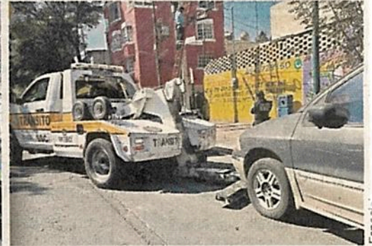
■ Ayer, se retiraron vehículos de la Colonia Pensil en atención a 14 reportes.

así como de inseguridad; ya que autoridades han detectado que estos vehículos son utilizados para pernoctar o guardar objetos que puedan generar prácticas delictivas.