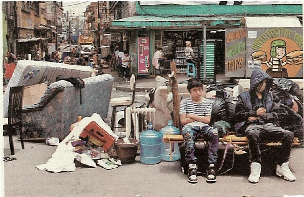
Capitalinos junto a sus pertenencias luego de ser sacados de sus viviendas, ubicadas en

Las imprecisiones jurídicas y lo blando de las leyes mexicanas en materia de vivienda permiten la proliferación de estos casos, donde el abuso es la norma. —