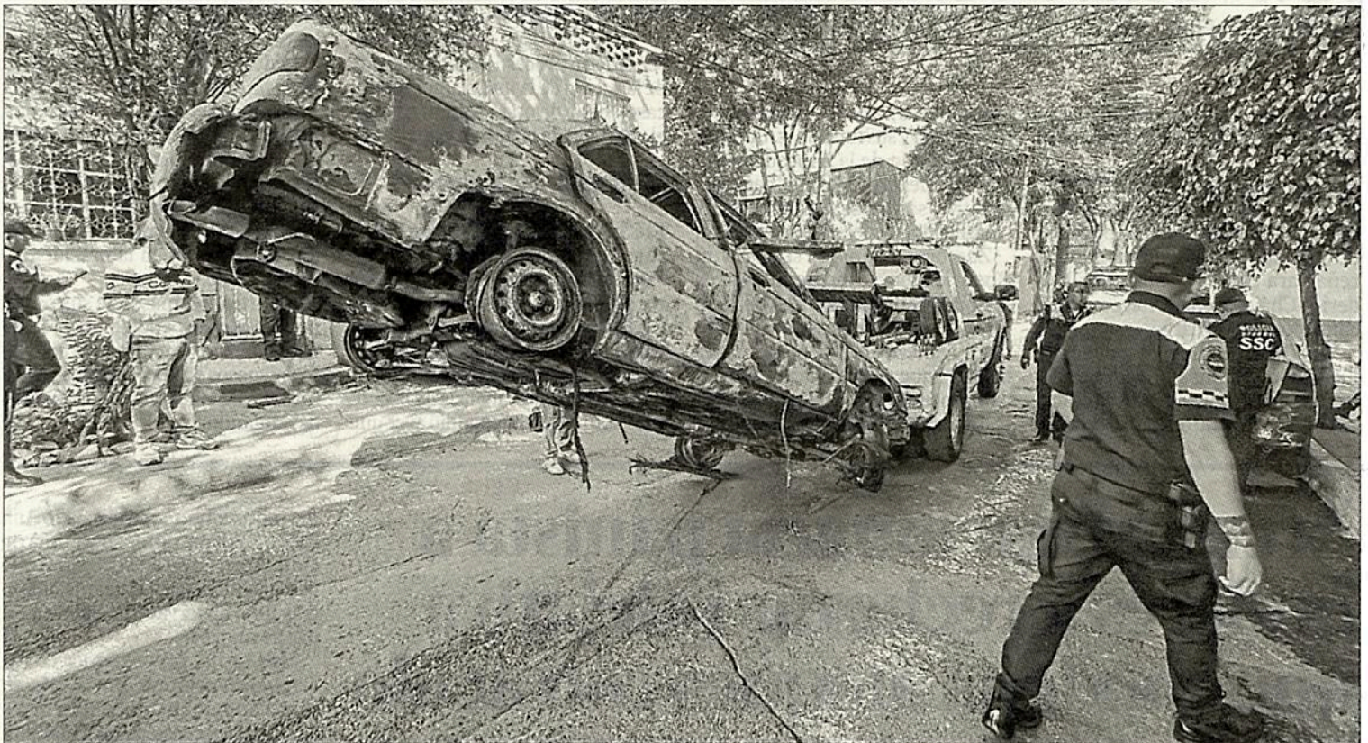
▲ Personal de la Subsecretaría de Control de Tránsito retiró de calles de la colonia Pensil vehículos abandonados.

Con el programa de chatarrización, el año pasado se retiraron 4 mil 300 vehículos, de los cuales mil 144 se compactaron; sin embargo, las denuncias por autos abandonados continúan, principalmente porque se convierten