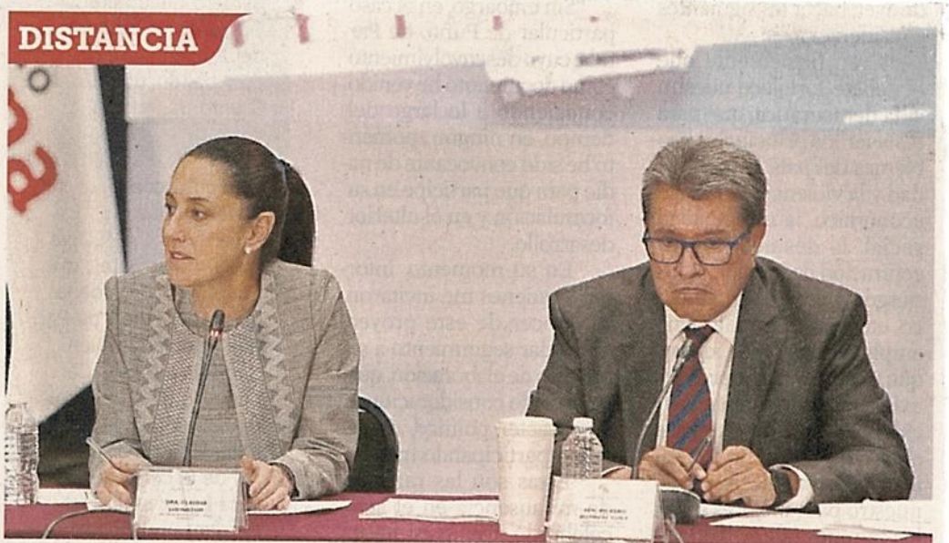
La Jefa de Gobierno, Claudia Sheinbaum, y el coordinador de Morena en la Cámara alta, quien le propuso "llevar la fiesta en paz".

"Lo único que puede afectar a nuestro movimiento es la falta de unidad", previene Sheinbaum. "Nadie de nosotros quiere que haya un paso atrás y nadie de nosotros quiere que haya un paso a la derecha. Nadie