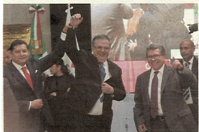
DE IZQ. A DER.: el presidente del Senado, Alejandro Armenta; el titular de la SRE, Marcelo Ebrard, y el senador Ricardo Monreal.