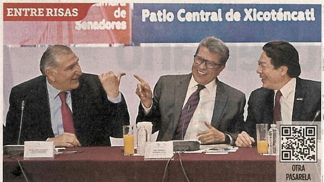
El Secretario de Gobernación, Adán Augusto López, y el senador Ricardo Monreal bromearon durante la plenaria de la bancada morenista. A la derecha, Mario Delgado, líder de su partido.

Con llamados a la unidad y un ambiente civilizado, tres precandidatos de Morena comparecieron ayer ante los senadores de su partido; el cuarto organizó la recepción