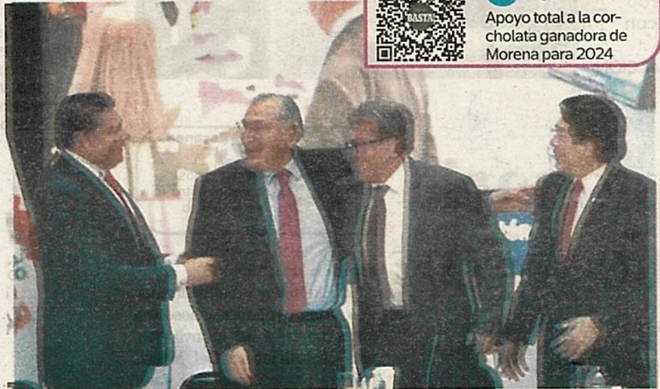
El partido en el poder cierra filas para profundizar la Cuarta Transformación

“Confiamos en que seremos capaces de trabajar juntos para construir una propuesta sólida y coherente que permita dar continuidad y profundidad al titánico esfuerzo que ha hecho nuestro