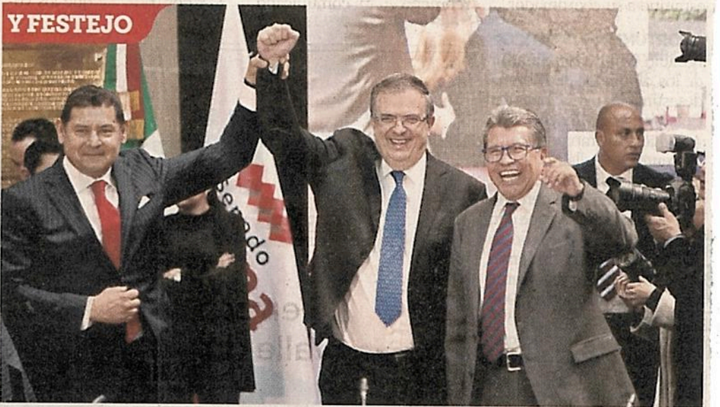
Los senadores Alejandro Armenta (izq.) y Monreal con el Canciller Marcelo Ebrard, tras su participación en la plenaria morenista.