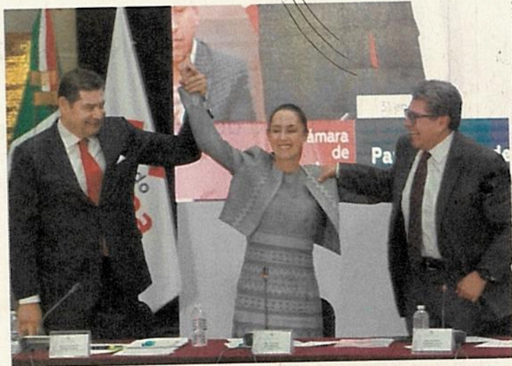
El líder de la Mesa Directiva del Senado, Alejandro Armenta, levantó la mano de Claudia Sheinbaum, acción que no compartió Ricardo Monreal.

"Hay como 30 personas que quieren participar, pero hemos acordado dar el mismo trato a todos. Si no preguntamos ni con el presidente del partido ni con el secretario de Gobernación, lo más correcto es que continuemos con la misma mecánica y que nos quedemos con esta excelente exposición que nos ha presentado", argumentó. ●