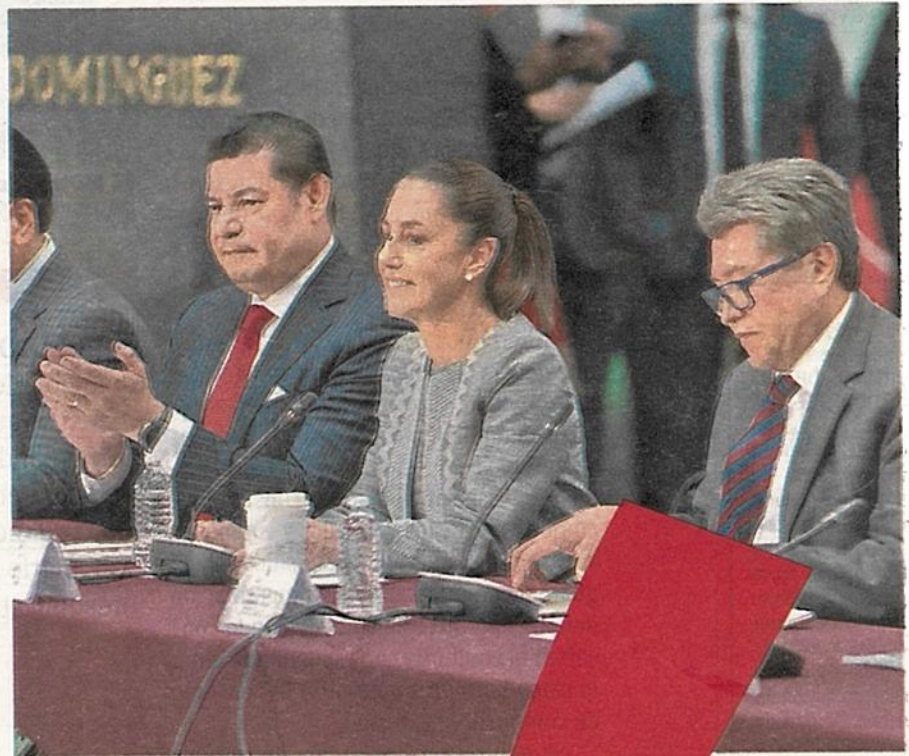
La mandataria recordó que el Metro transporta a 3 millones y medio de personas

"Y los dos proyectos clave que hemos desarrollado, además de otros de menor alcance, es la Nueva Línea I del Metro, pues esta línea tiene 53 años de construida con enormes problemas, y en vez de tomar la decisión de hacer una obra menor decidimos cambiarla por completo; el túnel de la Línea I se está vaciando, estamos en su pri-