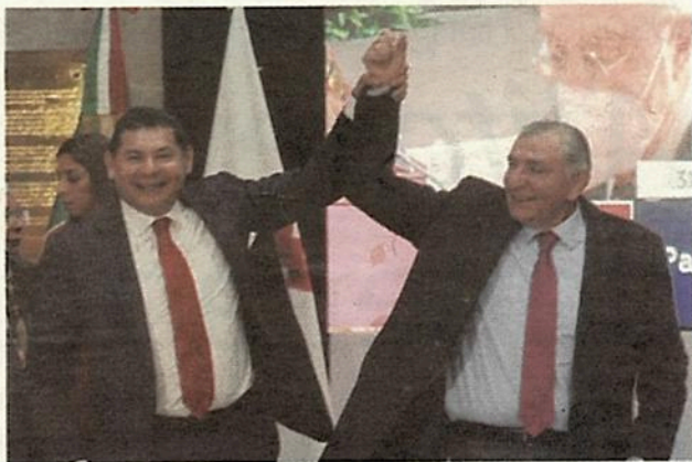
ADÁN AUGUSTO López Hernández, titular de la Secretaría de Gobernación, ayer durante la Plenaria senatorial.