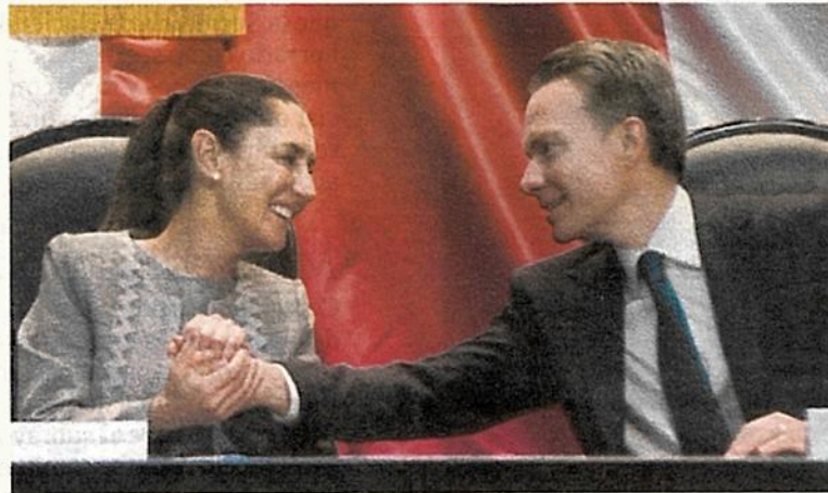
INVITADA. Claudia Sheinbaum, jefa de Gobierno, y el senador Manuel Velasco, ayer.

Ante ello, el presidente del Senado, Alejandro Armenta, fue el encargado de levantarle la mano a