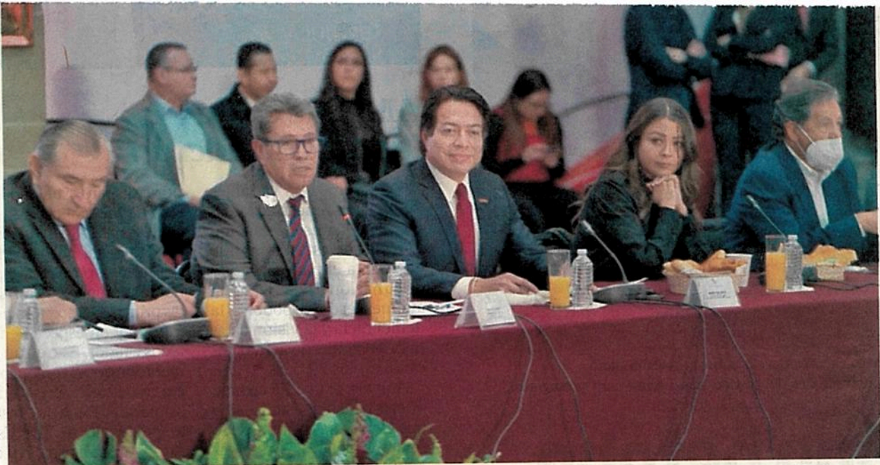
El presidente de Morena, Mario Delgado (centro) anunció que para participar en el proceso interno rumbo a 2024, los aspirantes deben cumplir con requisitos como comprometerse a la unidad del partido y aceptar el método de encuestas.

"Que haya debates, porque de otra manera será muy difícil ver qué es lo que cada quien propone con respecto a lo que le interesa a la población y me imagino que eso se va a regular", planteó. ●