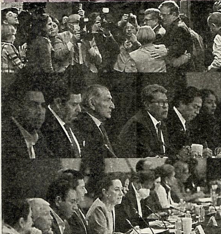
· Por segundo día estuvieron presentes las cuatro corcholatas