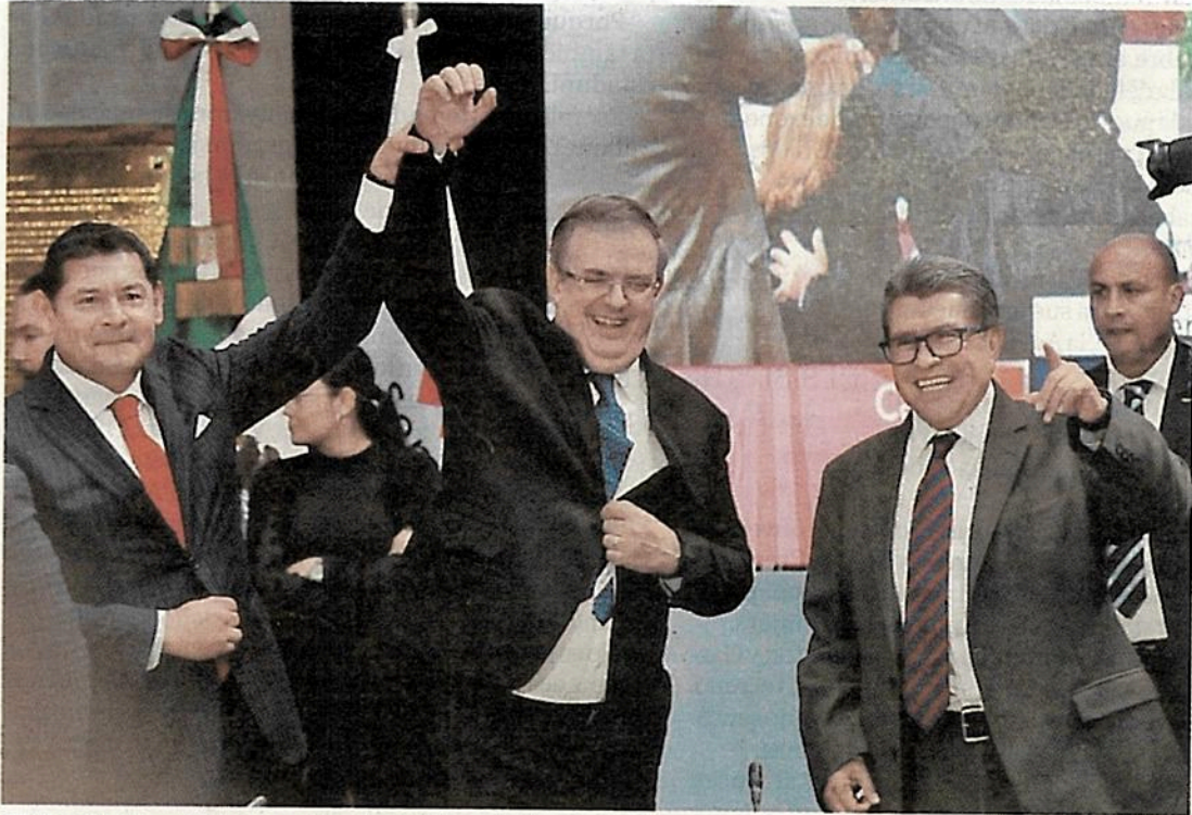
Alejandro Armenta, presidente del Senado, levanta el brazo de Marcelo Ebrard.