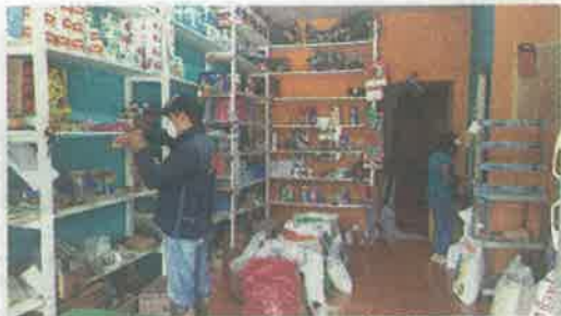
Muchos comercios amenazan con abrir