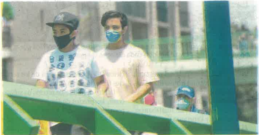
La CDMX aún no supera la crisis por la pandemia de Covid-19, más cuando van en aumento los casos de personas contagiadas

MIL 500 millones de pesos ha destinado el gobierno capitalino en ayudas sociales; el 1 de junio, tercer apoyo mensual a estudiantes de nivel pre-escolar y básico de la metrópoli