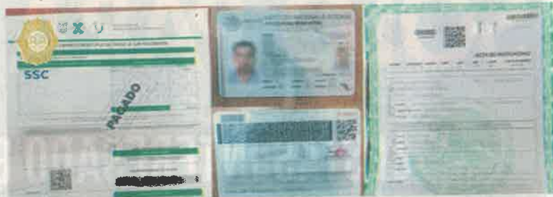
La banda sacaba provecho de las víctimas de la pandemia, al tramitar actas de defunción apócrifas