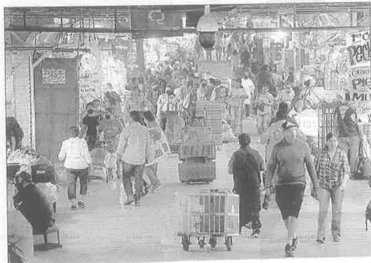
► Ese lugar tuvo gran afluencia sin que hubiera muchas medidas preventivas; la imagen, del 25 de abril.

Con esto, se pasa de 2 mil millones a 2 mil 500 millones de pesos los recursos destinados a distintos apoyos a la población más vulnerable durante la pandemia que vive la ciudad.