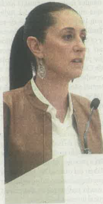
Se realizarán más pruebas

CIUDAD DE MÉXICO. — El Gobierno de la Ciudad de México, anunció que ya no adquirirá más ventiladores artificiales para tratar casos de intubación por Covid-19, porque con los 2 mil que existen en la red de hospitales en la Zona Metropolitana del Valle de México, más 6 mil para hospitalización por la pandemia, se podrá hacer frente a la pandemia.