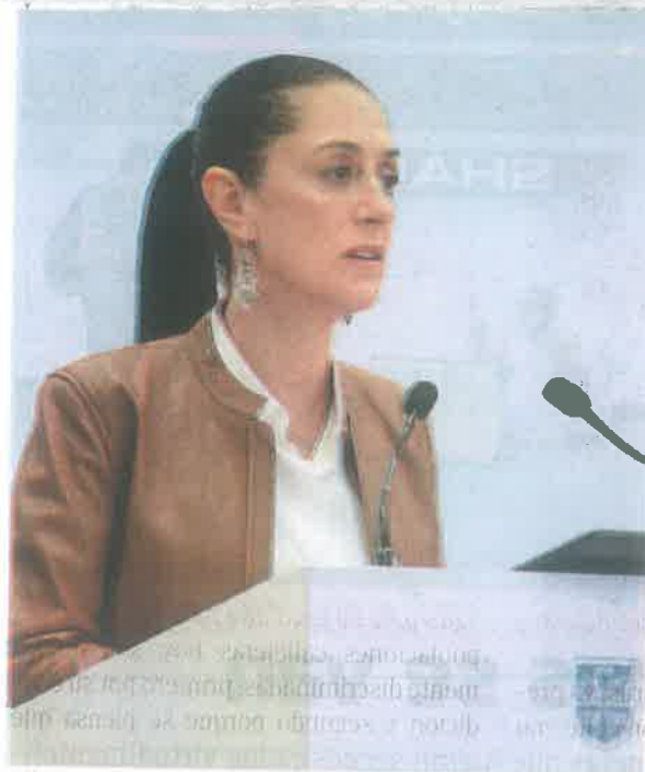
La mandataria informó que recibió 110 ventiladores que serán distribuidos

EN LOS tres meses se habrán entregado dos mil 700 pesos a los 1.2 millones de niñas y niños