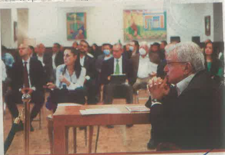
Reunión con la participación de la Jefa de Gobierno y sus otros datos

Lo primero a destacar es que en la conferencia de prensa nocturna encabezada por Hugo López-Gatell, se utilizan fechas de recopilación de datos, es