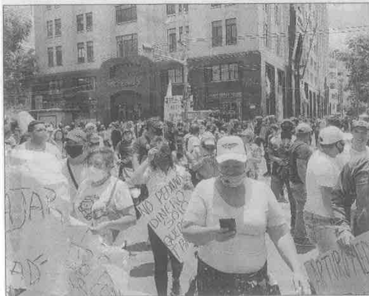
◀ Los vendedores bloquearon algunas calles para protestar por que no los dejan instalarse.

Advirtieron que en caso de que las autoridades capitalinas no permitan su regreso, a pesar de que el semáforo epidemiológico está en color naranja, realizarán movilizaciones hacia el Palacio Nacional y cerrarán varias avenidas.