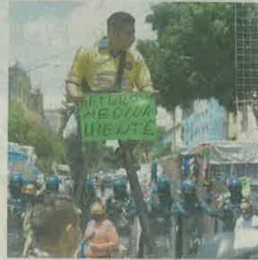
HUGO GARCÍA, EL UNIVERSAL