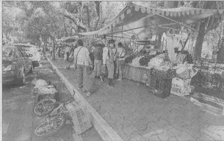
◀ En la Del Valle se observó mayor movimiento en este tianguis.

Los comerciantes manifestaron que no pueden obligar a sus clientes a usar cubrebocas o caretas, pues en este momento no los quieren incomodar.