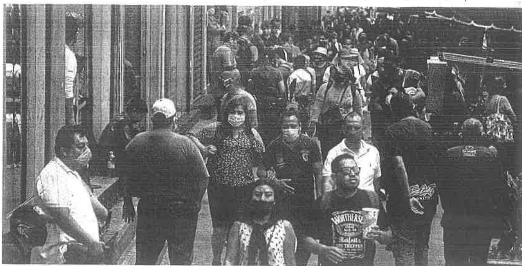
En el Eje Central se pudo observar una gran cantidad de personas, algunas utilizando cubrebocas y hasta carretas de acrílico; en cambio, otros no se preocupaban por seguir las medidas sanitarias ni de sana distancia para evitar un rebrote de coronavirus en la capital del país.