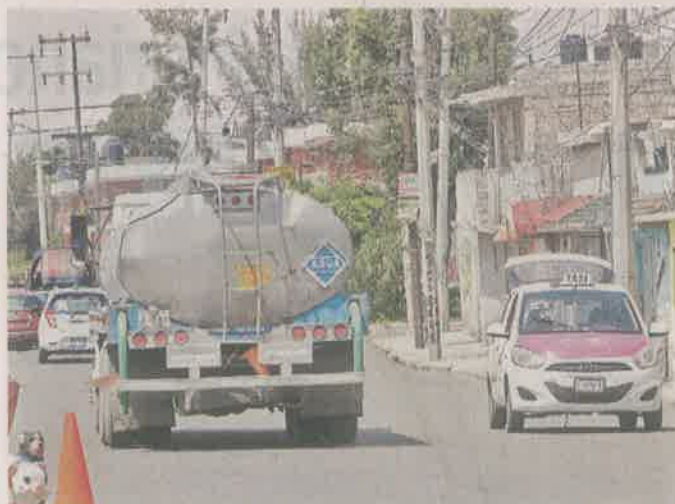
■ Al menos 624 vecinos deberían recibir 100 de agua cada uno.

Consultado al respecto, la Vocería de Ecatepec señaló que el Ayuntamiento está obligado a entregar el agua a los quejosos como lo determinaron los jueces y que han certificado la distribución del líquido ante Notario Público.