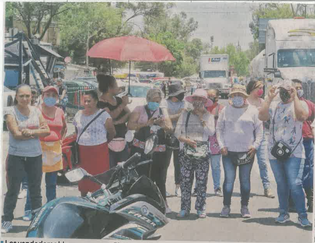
Los vendedores bloquearon ayer Eje Central y Eje 1 Norte para exponer sus demandas.