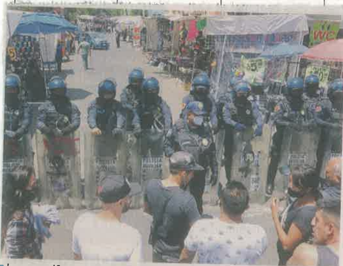
Los manifestantes fueron encapsulados por policías.