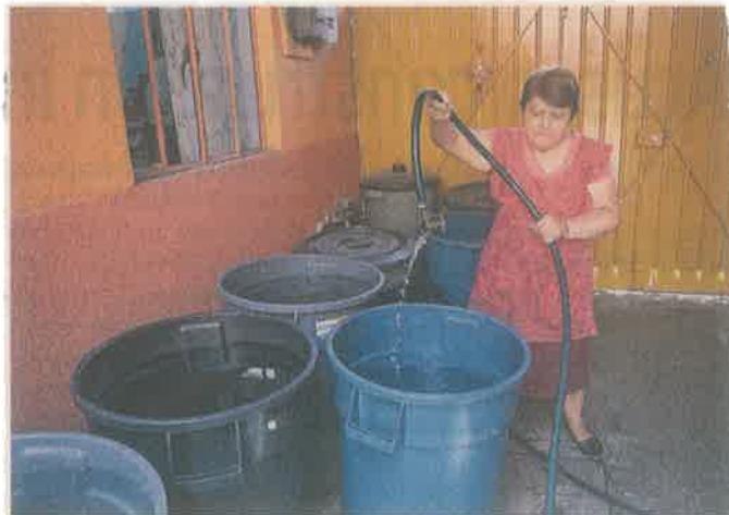
■ En Iztapalapa, vecinos llenaron recipientes con agua.

El recorte se tiene planeado que dure alrededor de 40 horas, después de que hayan iniciado las labores a partir de las 2:00 horas de hoy.