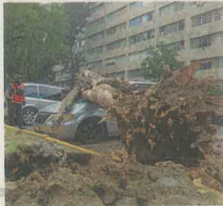
Al menos dos autos resultaron afectados por la caída del enorme tronco