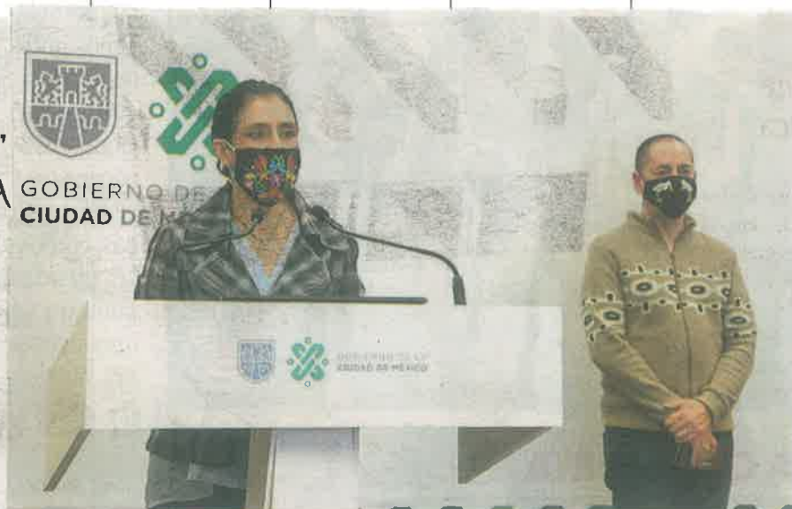
La titular de Salud, Oliva López Arellano, llamó a la ciudadanía a no adquirir vacuna en cualquier lugar, ya que aún no está disponible para el sector privado

de 280 mil dosis de vacuna antiinfluenza, que estará disponible a partir de la próxima semana en las unidades de salud del gobierno capitalino, donde se aplicarán alrededor 1.8 millones de dosis, que junto con instituciones como el IMSS, ISSSTE y otras se alcanzará una meta de 3.3 millones.