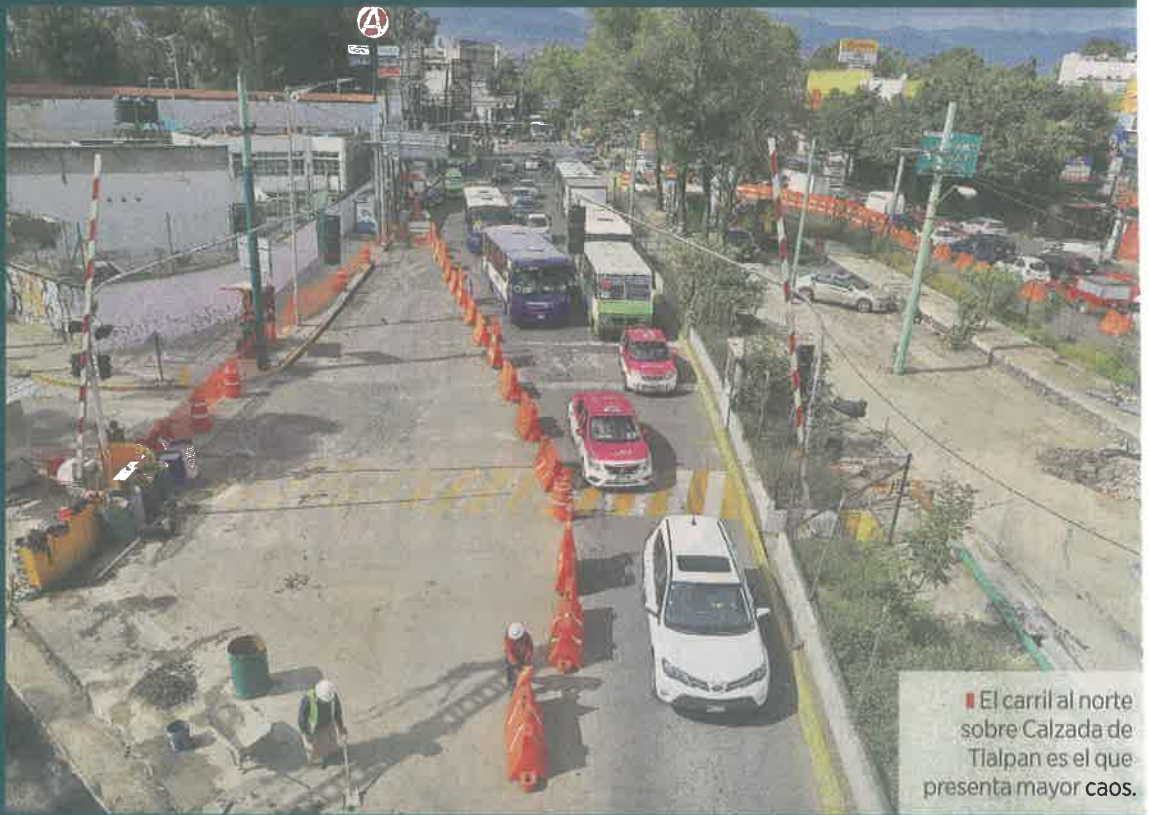
El carril al norte sobre Calzada de Tlalpan es el que presenta mayor caos.