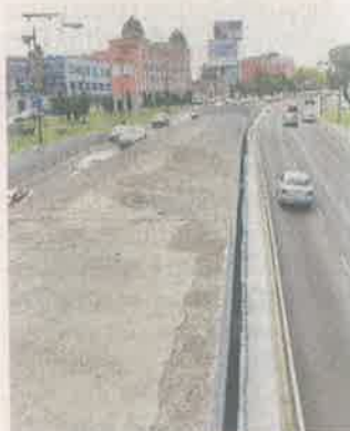
El Viaducto cedió un tramo de concreto a áreas verdes.

Es resultado de que se perdieron 18.7 kilómetros cuadrados de áreas verdes, pero a la vez se ganaron más de 3 kilómetros cuadrados con la vegetación de nuevas áreas verdes”.