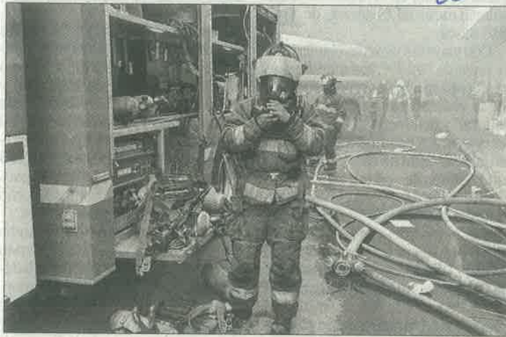
▲ Los bomberos lograron controlar la conflagración en República de El Salvador, donde no hubo heridos.