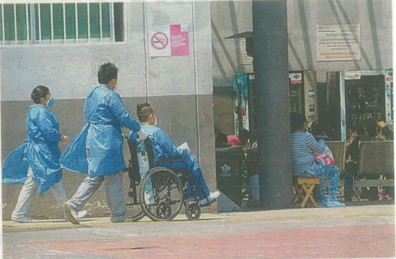
Esta es la segunda ocasión que en el semáforo naranja se declara en alerta a la ciudad por el incremento de personas hospitalizadas de Covid-19 /FEDERICO XOLOCOTZI