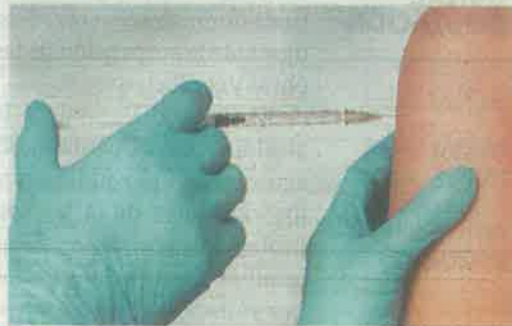
IMSS e ISSSTE aplicarán un millón 500 mil más

La Secretaría de Salud, prevé aplicar un millón 800 mil dosis, hasta el 31 de diciembre.