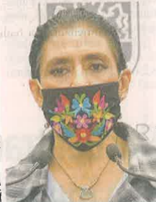
Olivia López Arellano, Secretaria de Salud

Un segundo lote de 280 mil dosis de vacuna de influenza comenzó a ser distribuido en los Centros de Salud para que esté disponible a partir de la próxima semana, agregó López Arellano.