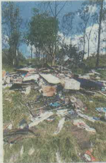
Tenían casuchas de madera

De acuerdo con autoridades de la Secretaría local del Medio ambiente, las hectáreas recuperadas habían sido ocu-