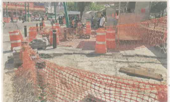
En la zona se amplían cruces peatonales 5 años después.

En glorieta crece un árbol que sustituye a uno sembrado por descendientes de Miguel Ángel de Quevedo, el cual se secó por podas inadecuadas y fue retirado en 2016.