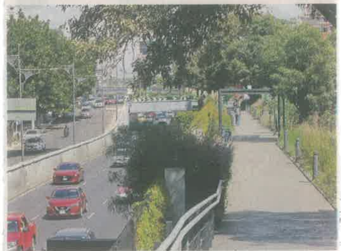
El Ecoducto es un parque lineal habilitado sobre 1.6 km, a propuesta de los ambientalistas Elías Cattán y Arnold Ricalde.

En contraste con nuevos fraccionamientos residenciales y conjuntos habitacionales en el área conurbada, en la CDMX se visualiza la conversión de superficies de asfalto en áreas verdes, como el Ecoducto sobre el cajón del drenaje en el Viaducto o un parque lineal encima del Gran Canal del Desagüe y, en menores dimensiones, también hay azoteas verdes, concluyó Juan Manuel Núñez.