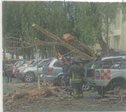
Los bomberos realizaron las maniobras para retirar el árbol