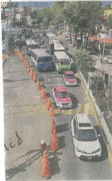
Los automovilistas prefieren usar el único carril de Tlalpan en dirección al norte.