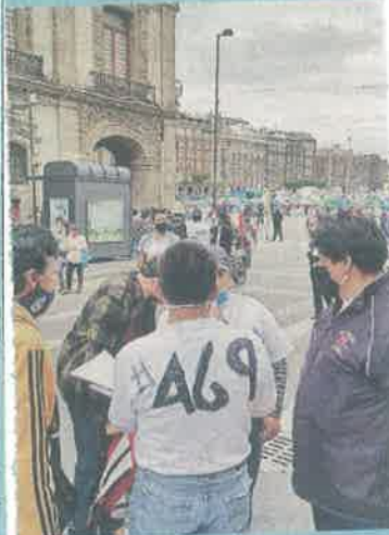
Empleados de diversas dependencias del Gobierno capitalino se manifestaron.

Un grupo de inconformes fue atendido por personal de la Secretaría de Gobierno, quienes les ofrecieron instalar mesas de trabajo.