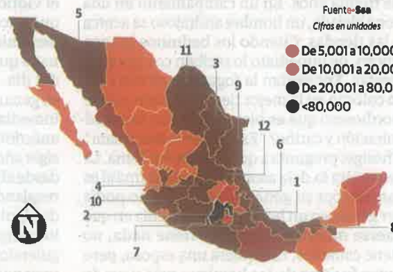
Cifras en unidades

Estados con más casos acumulados y decesos.