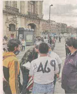
Personal de diversas dependencias se manifestó ayer.

“Nos dieron la base, pero con un código, 469, que nos impide recibir prestaciones y venimos a pedir que se haga