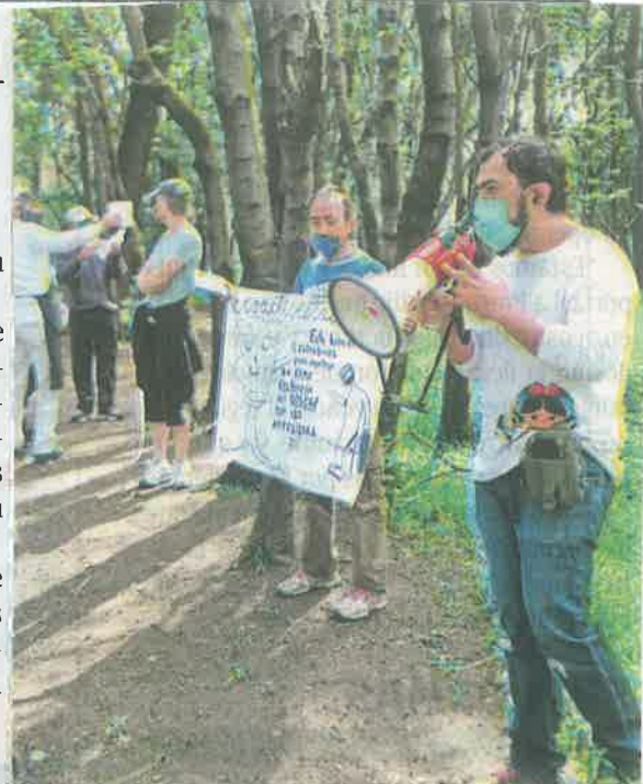
Vecinos rechazan el proyecto del Complejo Cultural Chapultepec por oneroso