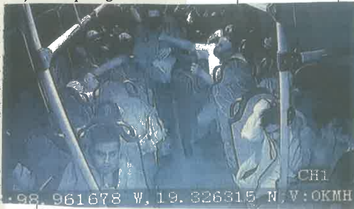
TOMADA DE VIDEO

Asimismo, expertos en seguridad refieren que si la gente hace justicia por su propia mano se puede normalizar y repetir en cualquier circunstancia. ●