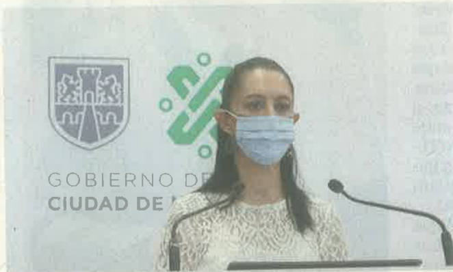
Claudia Sheinbaum, jefa de Gobierno, garantizó que trabaja con el IMSS y el ISSSTE en un programa contra diabetes y obesidad.

“Es fundamental —y esto es una reflexión frente a los decesos que hemos tenido por Covid— que nuestra pobla-