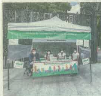
Módulos de información en Reforma acerca de Chapultepec.

Para la Cuarta sección se proponen una Bodega Nacional de Arte, una sede de la Cineteca Nacional, la Universidad de la Salud, la ExFábrica de Pólvora, el Puente de Los Polvorines, la Cañada del Hípico Militar, un Pabellón de Cultura Urbana, y un Taller Chapultepec que luego será un Taller de Artes y Oficios Ambientales. ● Sonia Sierra