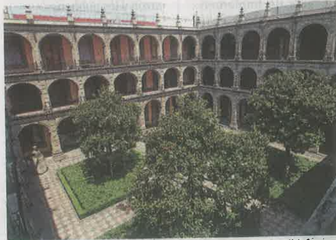
Se desconoce cuándo reabrirán El Antiguo Colegio de San Ildefonso.

La fundadora y directora de diversos museos y experta en el tema, comenta lo anterior ante el anuncio de Claudia Sheinbaum, jefa de Gobierno capitalino, de que los museos de la Ciudad de México abrirán el próximo martes 11 de agosto, con un aforo del 30 por ciento y "con estrictas medidas sanitarias", a pesar de que el semáforo epidemiológico de la