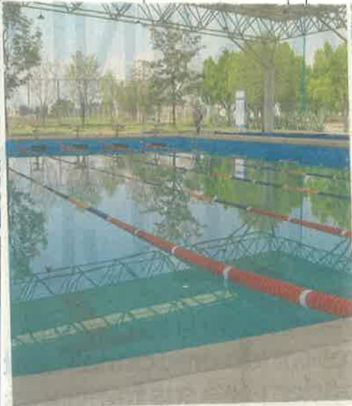
Con el anuncio, la alberca del deportivo Francisco I Madero, en Iztapalapa, podrá abrir.

Cines y museos abrirán con 30% de aforo y los asistentes deberán usar cubrebocas durante toda la función o el recorrido y se fomentará la compra electrónica de boletos. También se amplía el horario de servicio de los comercios, que ahora será de 10:00 a 17:00 horas.