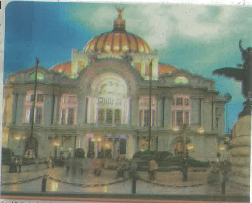
En el Palacio de Bellas Artes se está terminando el montaje de la muestra sobre Modigliani.

“Por ejemplo, en el Palacio de Bellas Artes se está terminando el montaje de Modigliani, en ese sentido, está muy claro que ya podrá abrir. En otros museos o están cambiando o montando exposiciones. Depende de eso (la