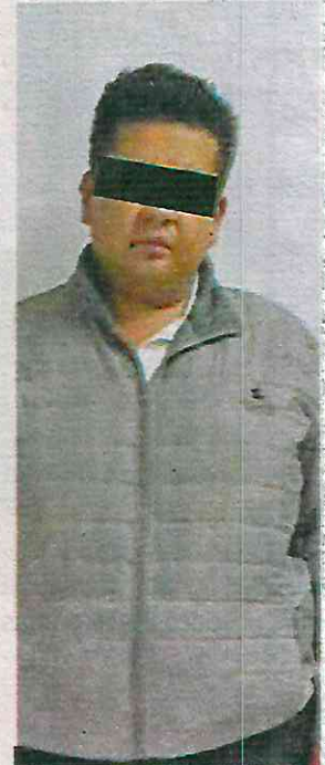
Los implicados utilizaban métodos violentos y amenazas hacia sus víctimas a la hora de cobrar los altos intereses

Con la información recabada, se obtuvieron datos de prueba que fueron presentados a un Juez de Control que liberó la técnica de investigación solicitada por el agente del Ministerio Público. Con los mandamientos ministeriales, los efectivos realizaron vigilancias fijas y móviles