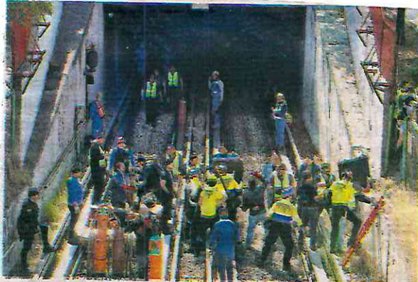
Accidente ocurrido en la interestación Potrero-La Raza

con la vida de una joven estudiante y dejó 106 heridos, dejando vergonzosamente sin ninguna responsabilidad al Sistema de Transporte Colectivo Metro”.