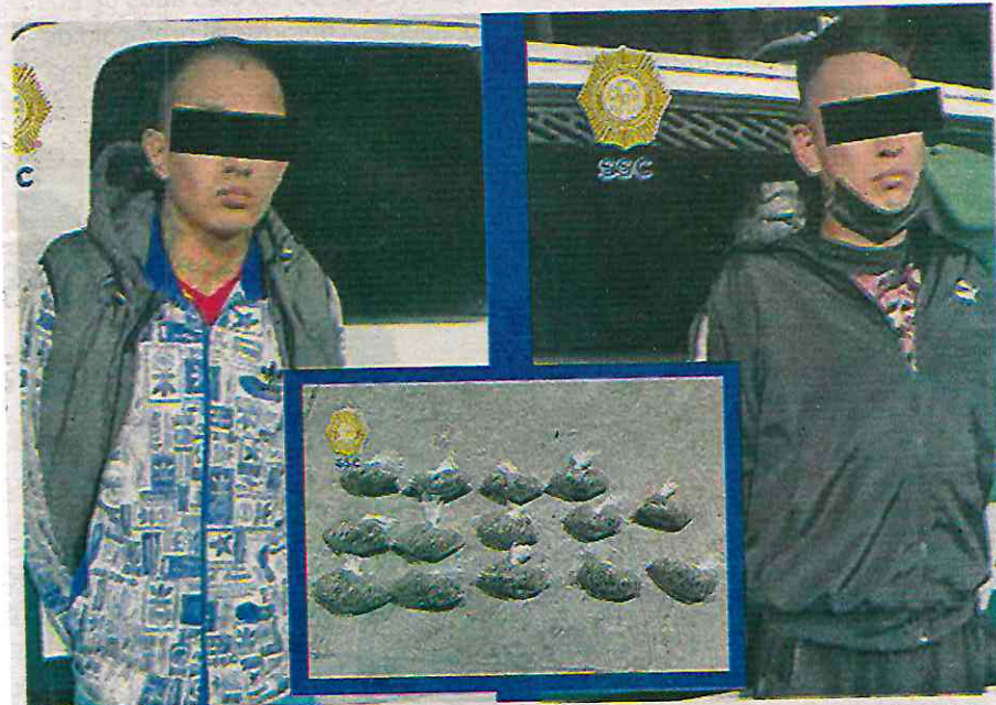
Los efectivos realizaban recorridos como parte de las acciones para evitar delitos en la zona cuando sorprendieron a los sujetos

Por tal razón, los efectivos detuvieron a los dos hombres de 20 y 32 años de edad, les leyeron sus derechos de ley y fueron llevados, junto con lo asegurado, ante el agente del Ministerio Público correspondiente, quien determinará su situación legal.