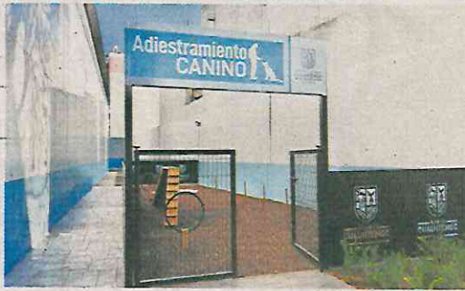
El albergue se encuentra ubicado en el Deportivo Morelos, en Tepito.

brá personal especializado para su atención.