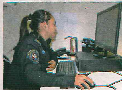
Ante cualquier emergencia, en Base Plata atienden todo tipo de percances

falsas, pues se ocupan tiempo de bomberos, médicos o elementos policiales para atender la supuesta emergencia, y descuidan otras actividades trascendentes.