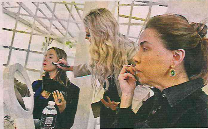
El objetivo de la capacitación es que las mujeres liberadas puedan iniciar un proyecto laboral.

“La ex pareja de mi hermano me acusó de ese delito, yo no tenía nada que ver y ella decidió que yo era cómplice de un delito del que nunca supe, hasta que me acusaron. Me costó cin-