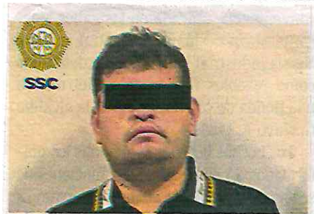
Se escondía en la CDMX, fue capturado por la SEMAR y SSC

Esta detención se llevó a cabo en estricto apego a los protocolos de actuación policial, uso de la fuerza y respeto a los derechos humanos. Al detenido se le informaron sus derechos de ley y fue puesto