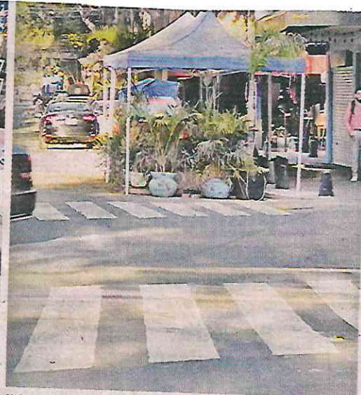
La ciclovía sobre Avenida José Martí recorre 2 kilómetros, atravesando la Escandón I y II.