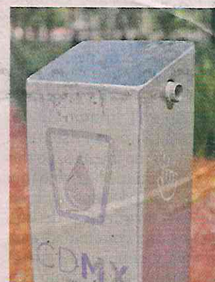
En espacios como la Alameda Central, presentan daños.