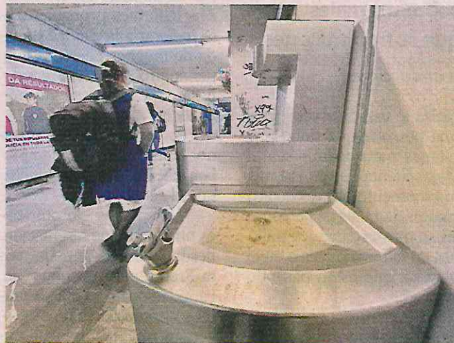
Los bebederos del Metro fueron clausurados hace tres años.

“La pandemia no ha terminado. Y los bebederos son estructuras en donde se concretan virus y hongos que se transmiten por contacto. Hasta que las autoridades de la Ciudad de México y de salud no hagan campañas sobre el uso adecuado de bebede-