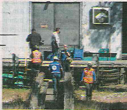
En el choque una joven murió