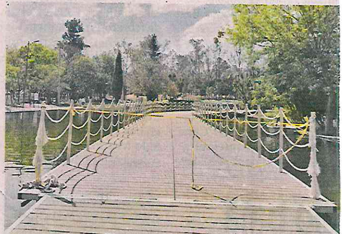
Los puentes flotantes aún están en proceso, por lo que los visitantes no pueden acceder a estas zonas.

El recorrido de esta sala toma menos de 39 minutos y tiene como objetivo concientizar sobre las acciones que se deben seguir para conservar espacios, como el Bosque de Chapultepec, frente al cambio climático.