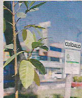
El proyecto incluye la colocación de fichas informativas.