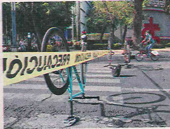
Ciclistas cuestionan la falta de atención de policías

Los incidentes viales no bajaron, pero sí aumentaron las carpetas de investigación abiertas por la Fiscalía General de Justicia local tras los cambios al Código Penal capitalino, aseguró la directora de Seguridad Vial y Seguimiento a la Información de la