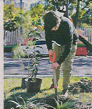
Los vecinos se encargan de realizar esta tarea.

“Cuando hay árboles, hasta la temperatura cambia, y aquí hemos visto que cada vez hay más, entonces así es una forma de poder recuperar los espacios”, aseguró.