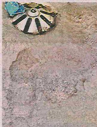
Una capa de salitre cubre un bebedero en la estación Tacuba del Metro.