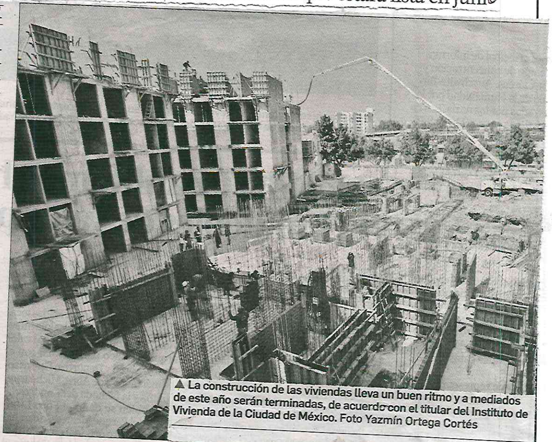
▲ La construcción de las viviendas lleva un buen ritmo y a mediados de este año serán terminadas, de acuerdo con el titular del Instituto de Vivienda de la Ciudad de México.

El director del Invi señaló que con el proyecto de Fresno 409 se atiende una demanda histórica para hacer justicia social a los habitantes de estos campamentos, que podrán acceder a créditos del organismo con mensualidades simbólicas y así obtener un departamento.