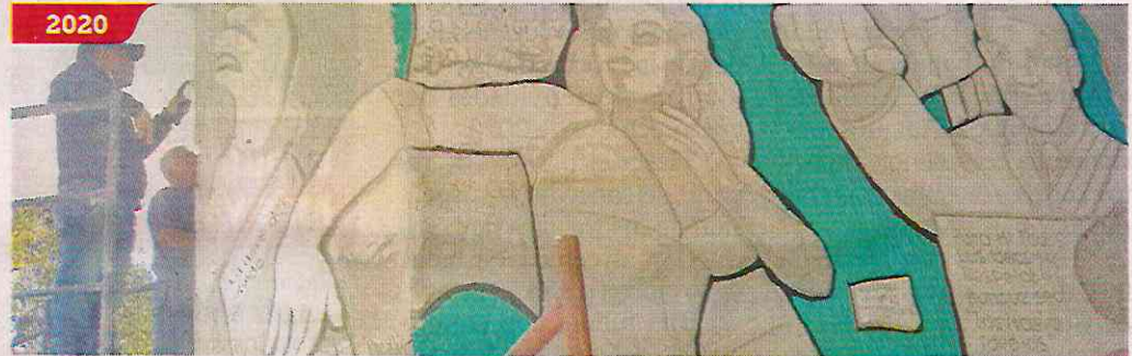
Los murales se encontraban en el Salón de Usos Múltiples y en el Teatro de la Juventud.

En tanto, en una columna del Teatro de la Juventud fue borrada una pieza de escultoesgrafiado, técnica basada en los relieves prehispánicos, y sobre la cual fue colocada