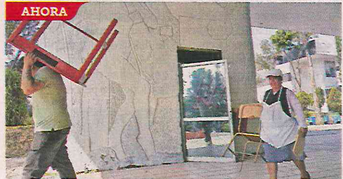
Fueron cubiertos por pintura blanca por una remodelación, de acuerdo con trabajadores.

El artista detalló que otros murales, como el realizado por la artista colombiana