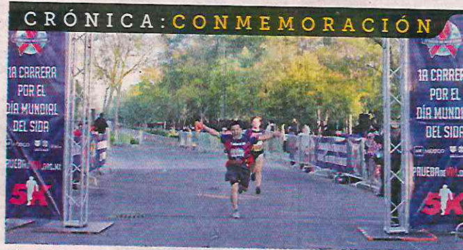
La carrera fue organizada por AHF México.

“En el pasado se habían hecho algunas carreras al respecto de VIH, pero no había visto esa participación, y el