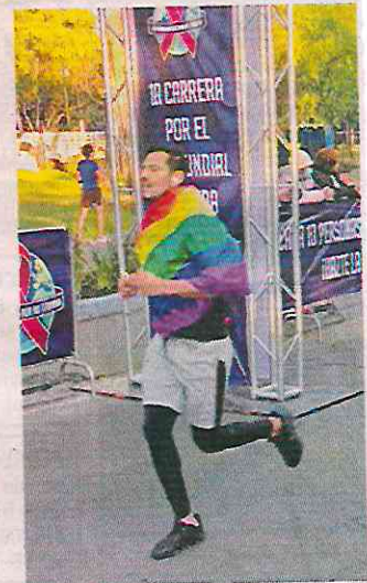
Algunos participantes corrieron con la bandera LGBT+.