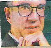
CARLOS ELIZONDO MAYER-SERRA @carloselizondom

Con la marcha de hoy no se sabrá cuánto apoyo real tiene AMLO, solo cuán potente es la maquinaria movilizadora.