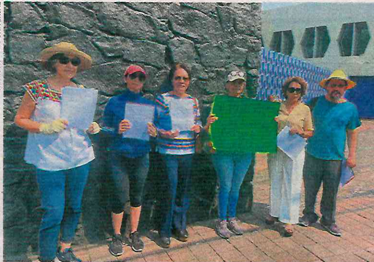
Habitantes de Benito Juárez argumentan que la contaminación les impide tener derecho a agua salubre y para uso personal y doméstico.