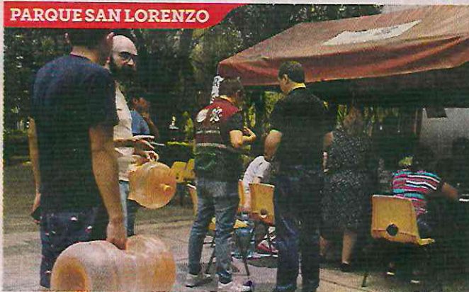
En la Colonia Del Valle estará disponibles hasta el domingo.

potabilizadoras móviles, de Femsa y la Marina.