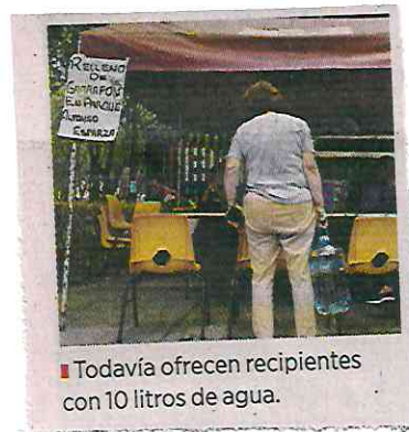
Todavía ofrecen recipientes con 10 litros de agua.

“El agua de la red sigue llegando con un olor a insecticida, por eso decidimos en el edificio esperar a que se vacíe la cisterna para lavarla,