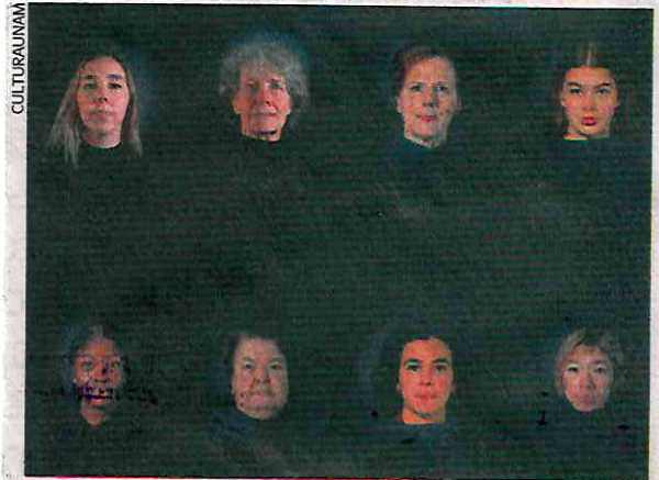
La instalación de Eno será exhibida a partir del 8 de mayo en el Colegio de San Ildefonso, como parte de El Aleph