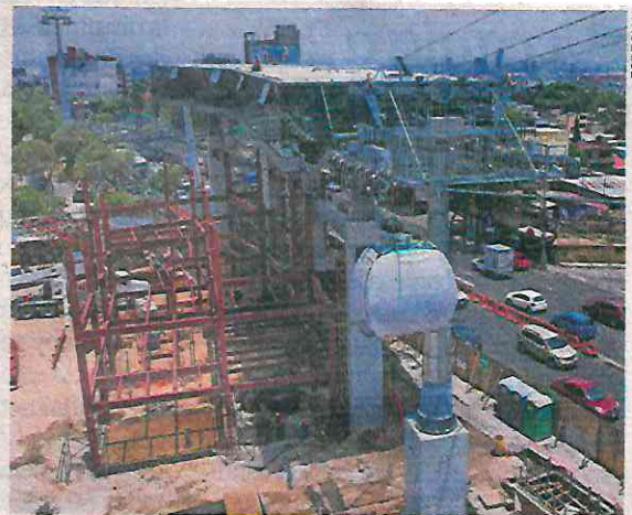
La instalación de los cables ya concluyó y las cabinas han comenzado a ser colocadas.

“Suman 5 mil 725 metros cuadrados de nueva creación de área verde al interior del bosque en diferentes áreas, y una rehabilitación de 2 mil 852 metros cuadrados en diferentes áreas verdes”. ●