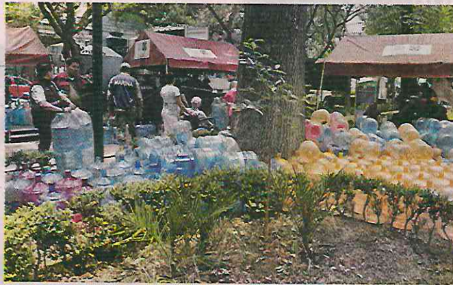
En la Nápoles, aún funcionan dos potabilizadoras móviles.

Vecinos que acudieron ayer a San Lorenzo fueron remitidos al Parque Esparza Oteo, situado en la Nápoles, en donde aún funcionan dos