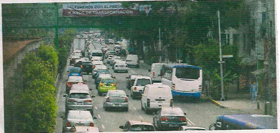
Propaganda en puentes de Tlalpan, en el tramo de Chabacano a San Antonio Abad