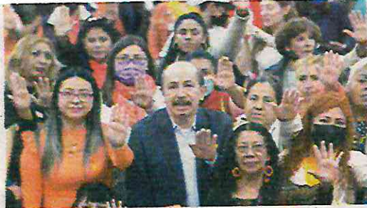
Por erradicar violencia en la alcaldía