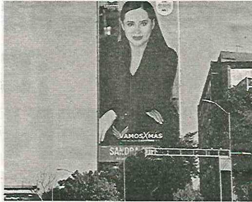
Tapizó un edificio con su cara