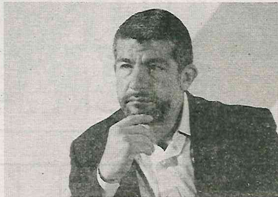
· Gobierno del panista cambió los proyectos de PP