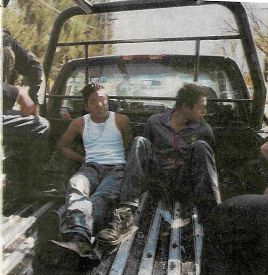
Los adolescentes cercanos a los 18 años, los que más cometen ilícitos