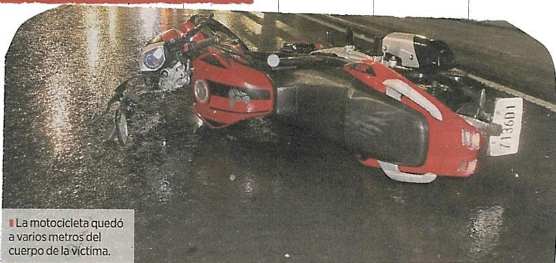
La motocicleta quedó a varios metros del cuerpo de la víctima.

La motocicleta, con placas 7136D1, fue trasladada a la agencia investigadora correspondiente.