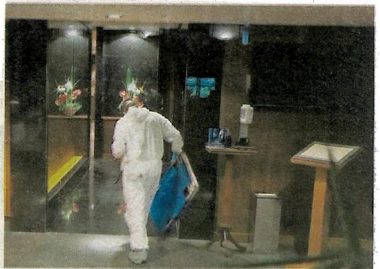
Peritos y agentes de la Policía de Investigación de la FGJCDMX continúan con las indagaciones