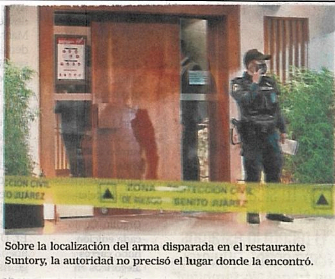
Sobre la localización del arma disparada en el restaurante Suntory, la autoridad no precisó el lugar donde la encontró.

En tanto, el cuerpo de Yrma Lydya fue entregado a sus familiares por parte de las autoridades capitalinas. ●