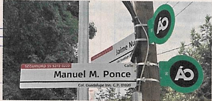
Las láminas instaladas dejaron de lado las normativas.

Estas últimas son de fondo verde, tienen la insignia de la actual Alcaldía y un número telefónico de seguridad, conocido como base plata.