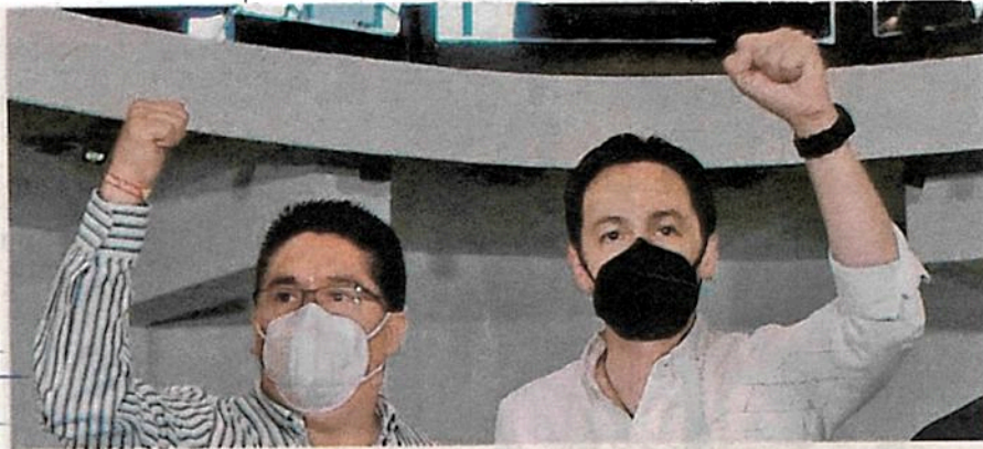
Tras considerarse fundada la omisión hecha valer por el PRD, en escrito de demanda, ya que el consejo no realizó un cómputo de las casillas