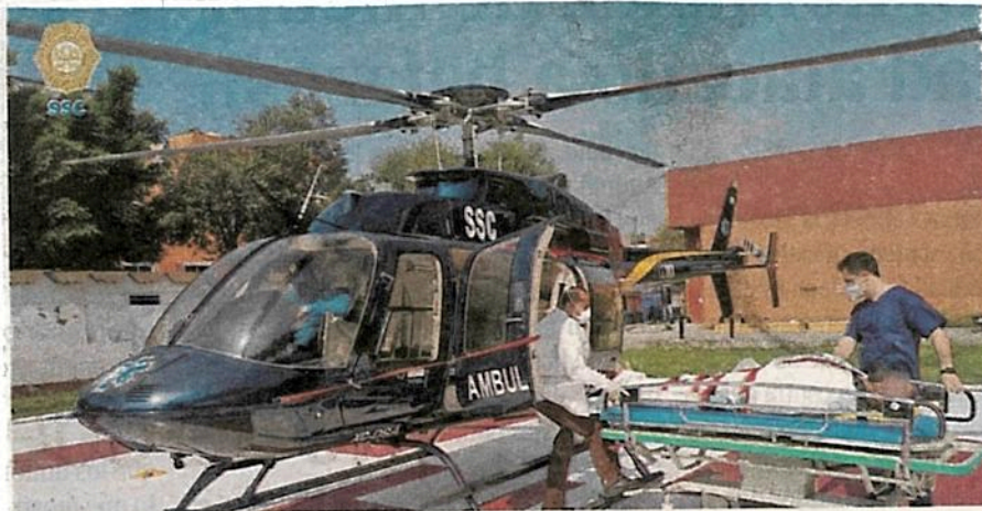
Oportuna labor del grupo "Cóncores", en el traslado de personas a nosocomios lejanos

Al arribar al Instituto, los médicos ya esperaban al paciente, por lo que personal de los Cóncores realizó la entrega para continuar con la atención correspondiente a su estado de salud.