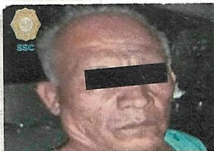
El agresor permaneció en el lugar y fue asegurado por la policía inmediatamente

Cabe destacar que, derivado del cruce de información, se pudo conocer que el detenido registra tres ingresos al Sistema Penitenciario de la Ciudad, dos por el delito de robo agravado y uno por privación ilegal de la libertad en los años 2011 y 2005, respectivamente.