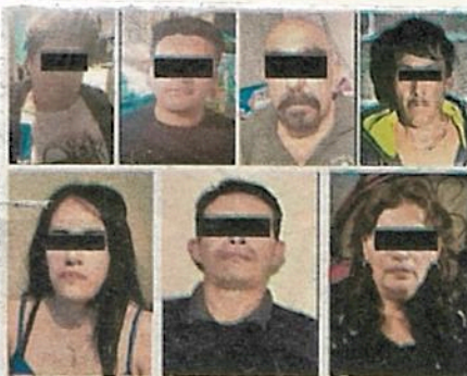
Todos por sus actividades, señalados como generadores de violencia