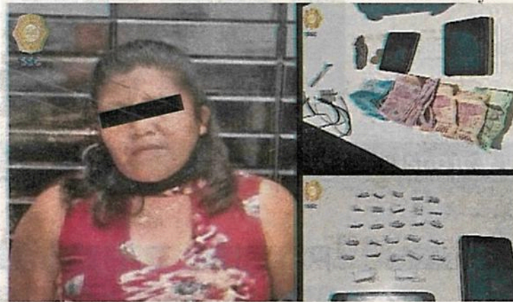
Aseguran a la mujer, 27 envoltorios con polvo blanco con las características propias de la cocaína y dinero en efectivo