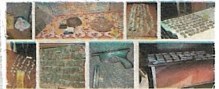
Gran cantidad y variedad de estupefacientes hallaron en los tres cateos

Además, resultado de la información obtenida, se pudo saber que el hombre detenido de 45 años de edad, cuenta con dos ingresos al Sistema Penitenciario de la Ciudad, por los delitos de Robo y Tentativa de robo calificado, en los años 1995 y 1997, respectivamente.