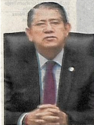
CAPTURA DE VIDEO