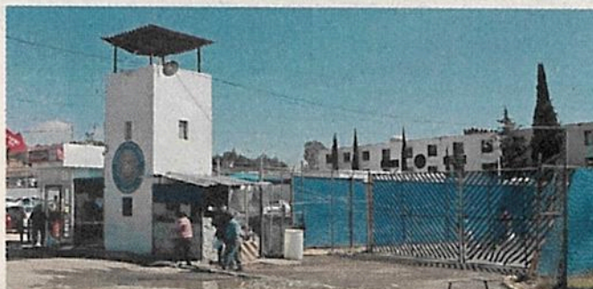
La Fiscalía del Estado de Puebla recibió la notificación del hallazgo en el penal desde el 10 de enero.