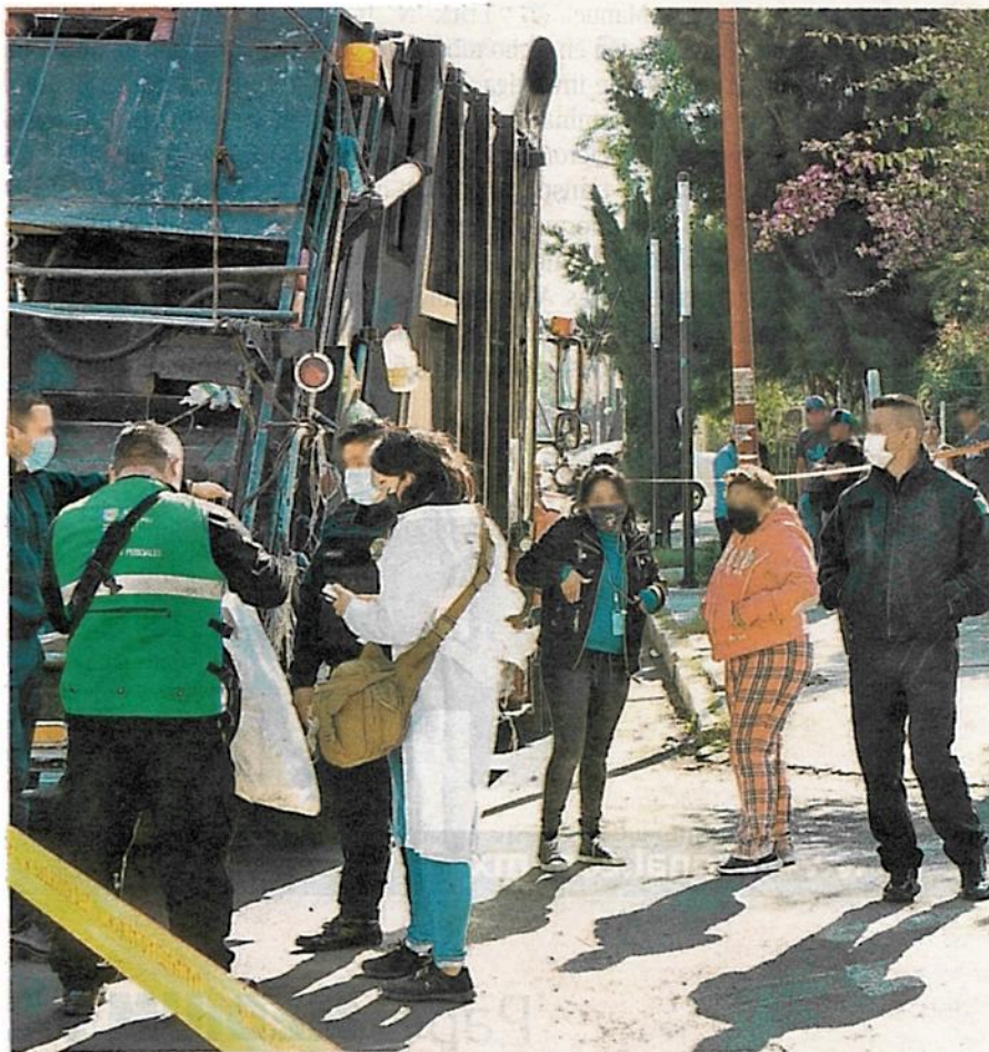
Por medio de las cámaras de videovigilancia dieron seguimiento al camión, por lo que fue interceptado por elementos de la SSC

Al lugar del accidente llegaron la hija y nieta de la señora Rosalba "N", quienes identificaron el cuerpo y posteriormente fueron llevadas al MP para rendir su declaración e iniciar la carpeta de investigación contra el presunto responsable.