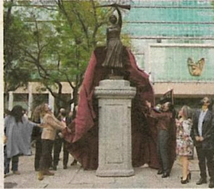
Las figuras fueron develadas ayer

haya más figuras femeninas, tras años de contar mayoritariamente con esculturas de hombres que también construyeron la historia de México.