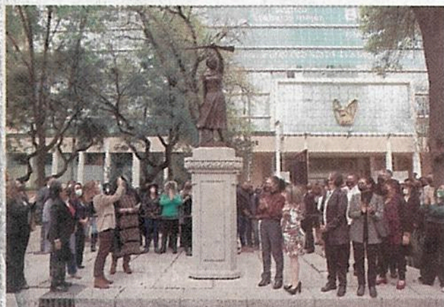
Del paseo, inaugurado en agosto de 2020, ya se han instalado, con estas cuatro, diez esculturas de mujeres destacadas.

Con estas cuatro, ya están instaladas 10 esculturas sobre este paseo inaugurado en agosto de 2020.