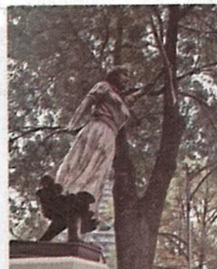
Evocan a Carmen Serdán, Juana Belén Gutiérrez, Matilde Montoya y Sara Pérez.