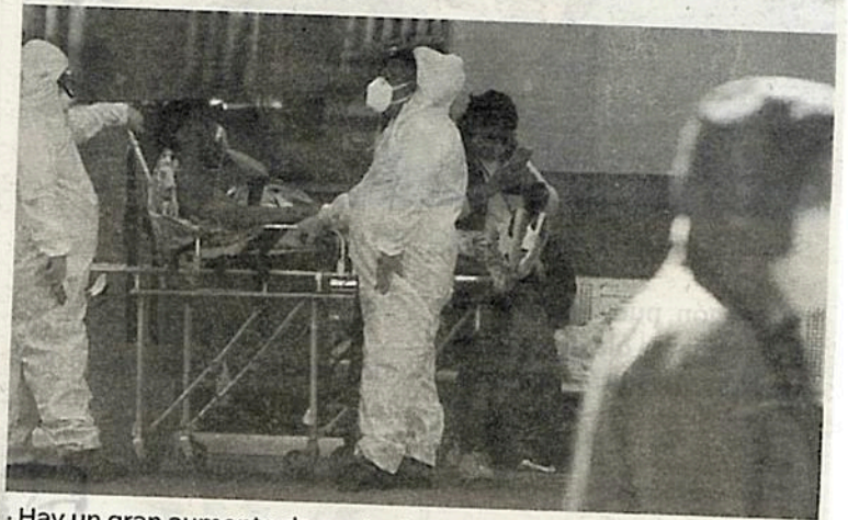
Hay un gran aumento de contagios

12 CIUDAD DE MÉXICO. — Ante la creciente alza de contagios como parte de la cuarta ola de Covid-19 en la capital del país, la alcaldía Iztapalapa, gobernada por Clara Brugada, de nuevo se posiciona como la demarcación con más casos activos en la capital del país, teniendo hasta el último corte de información del 19 de enero, 10 mil 979 casos.