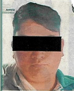
El sujeto fue ingresado al Reclusorio Oriente.

Trabajos de campo y gabinete realizados por personal de la Fiscalía de Investigación del Delito de Feminicidio de la Coordinación General de Investigación de Delitos de Género y Atención a Víctimas, con apoyo de la Secre-