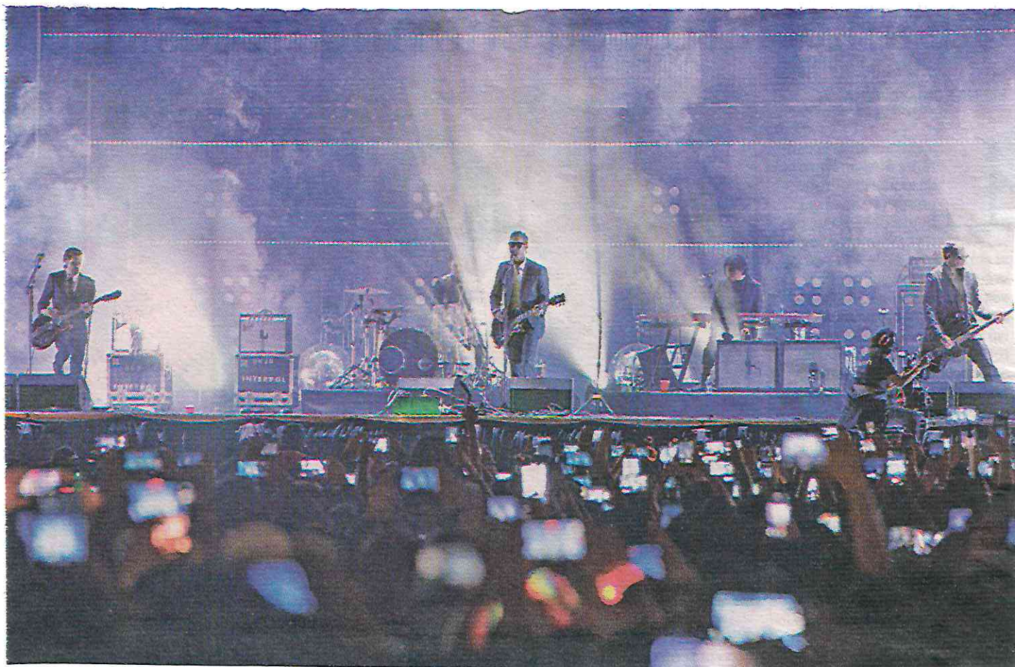
▲ La agrupación neoyorquina ofreció un concierto en la Plaza de la Constitución, ante 160 mil personas.

El gobierno de la Ciudad de México informó que en la realización de este evento masivo participarían más de mil 700 servidores públicos, apoyados con 155 vehículos pertenecientes a 14 secretarías y dependencias capitalinas. En cuanto a la derrama económica, anunció que podría ser de unos 950 millones de pesos, derivada de la actividad registrada principalmente en los sectores de transporte, alojamiento, alimentos preparados, entretenimiento y de comercio, cuyos giros son principalmente restaurantes, minisuperes, tiendas de abarrotes, bares, cafeterías y hoteles.