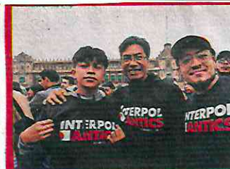
Paul Banks y fans lucieron el logo de la banda en su topa.

Así, con los edificios teñidos de un rojo intenso, junto al negro de la noche y la bandera de México ondeando, se despidió Interpol de la que dicen, es su segunda casa.