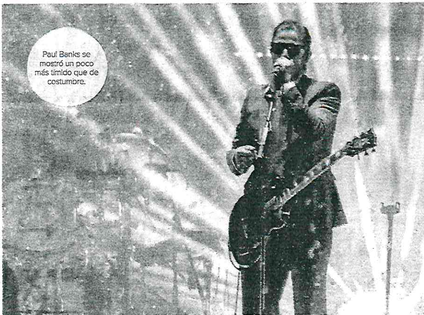
Paul Banks se mostró un poco más tímido que de costumbre.

EL GRUPO LIDERADO por Paul Banks dio anoche un show gratuito con el Zócalo lleno