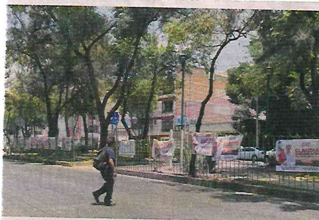
Alrededor del Sendero Seguro fueron colocadas decenas de lonas que promueven a la morenista Claudia Sheinbaum.