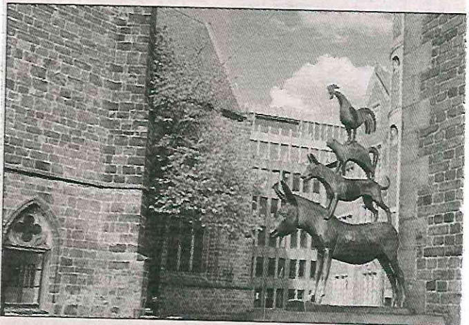
▲ Los músicos de Bremen , en el centro de la ciudad. Patas y hocico del burro visiblemente brillantes ante la creencia del cumplimiento de un deseo.