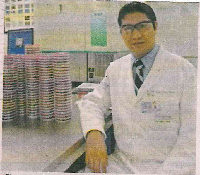
El presunto feminicida serial es biólogo y tiene 39 años de edad.