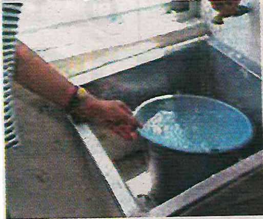
Vecinos de BJ han denunciado problemas