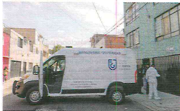
PERSONAL de la FGJCDMX, durante investigación al edificio de Miguel "N", el pasado 16 de abril en CDMX.

Hasta el momento, Miguel "N" está relacionado con el asesinato de una menor y el ataque de su madre, quien se encuentra hospitalizada, aunque se pueden adherir otros más que han sucedido en la alcaldía Iztacalco; incluso, en los primeros reportes se detalla que el presunto agresor habría utilizado sus conocimientos en química para realizar sus crímenes, al ser laboratorista.