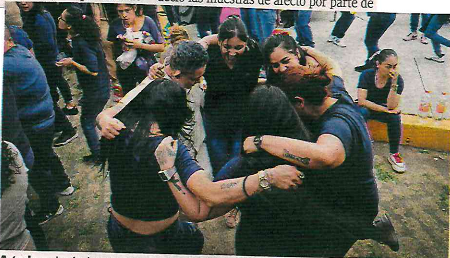
A todo pulmón las mujeres privadas de su libertad cantaron y lloraron con la música de El Haragán y Cía