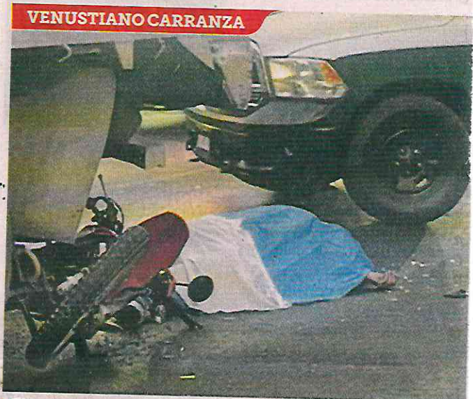
■ El motorista chocó, presuntamente a exceso de velocidad, con la plataforma de un camión en Calzada Zaragoza.