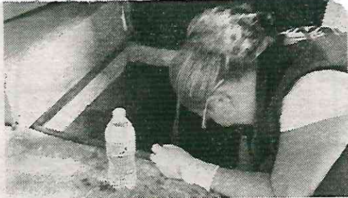
La autoridad solicitó un perito ambiental