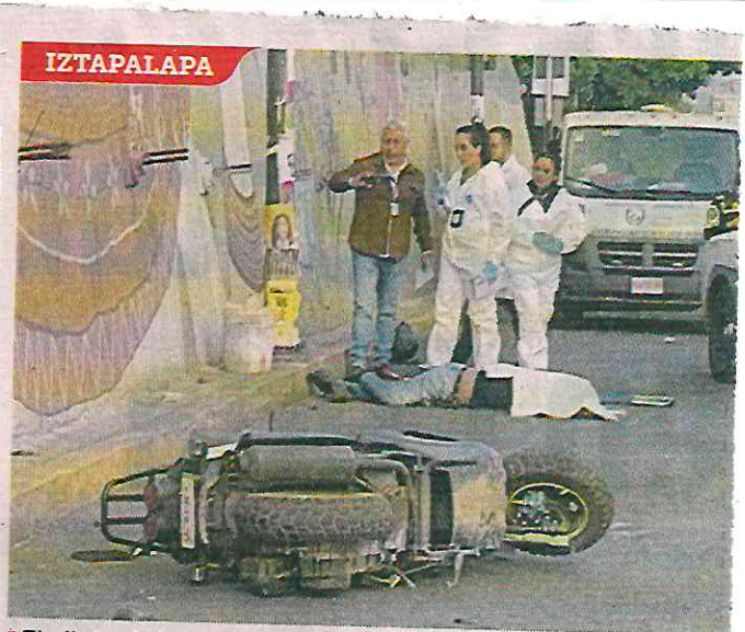
■ El piloto de la moto derrapó al circular sobre Avenida de las Torres, en Santiago Acahualtepec.

Paramédicos del ERUM, al notar que tenía signos vitales, lo trasladaron a un hospital cercano, sin que se revelara su estado de salud.