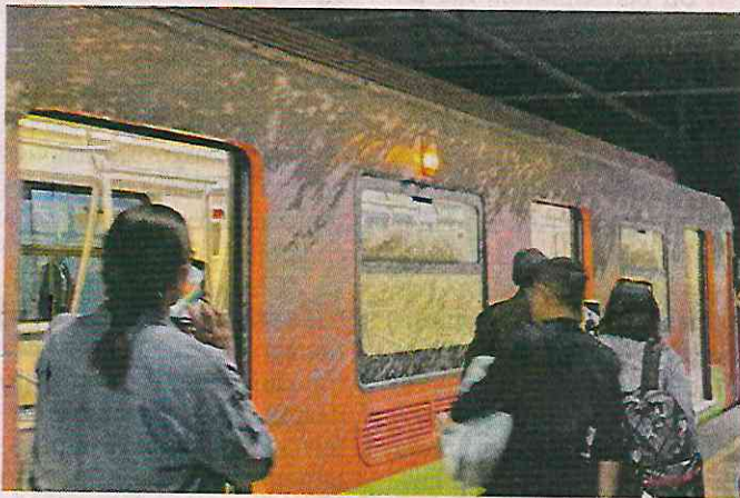
■ Cemento diluido con agua ingresó al tramo subterráneo de la Línea 12.