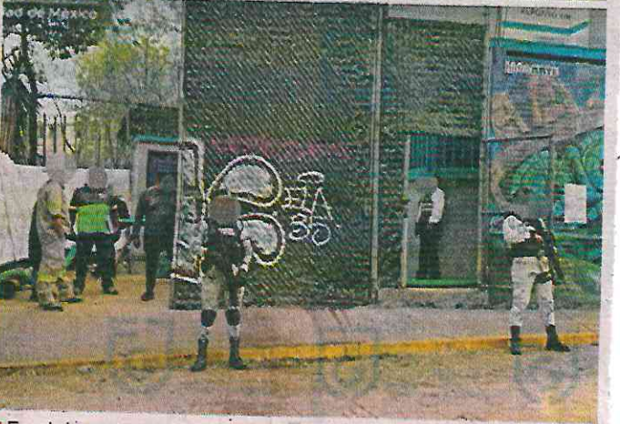
En el departamento del acusado hallaron restos óseos e identificaciones de mujeres.