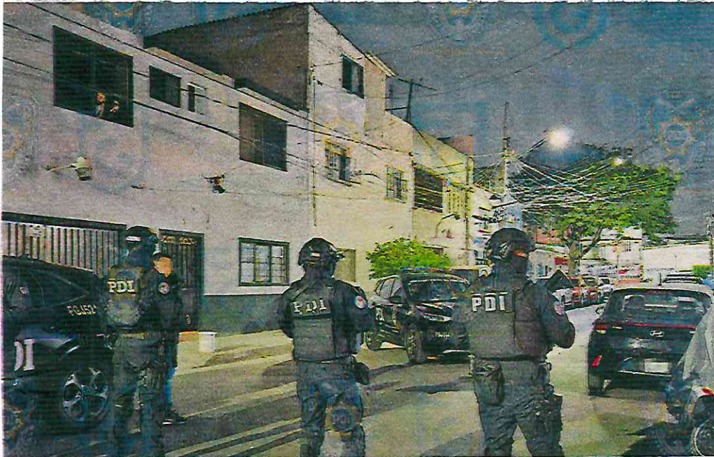
Elementos de investigación encontraron cráneos, serrucho y libretas en la casa del monstruo de Iztacalco