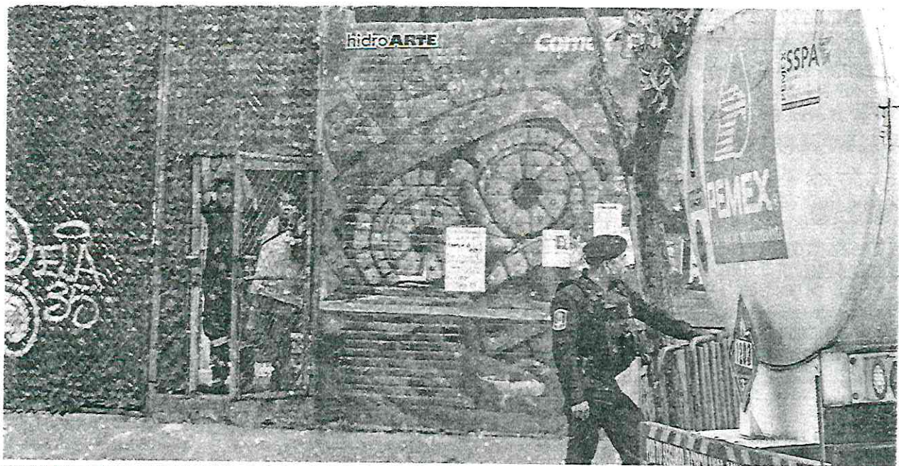
El pozo Alfonso XIII , cerrado el 10 de abril por ser el origen desde donde se distribuía el agua contaminada, permanecerá resguardado.