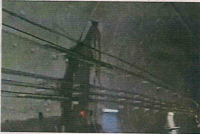
14 DE MARZO. El brote al interior de la Línea Dorada fue detectado a mediados de marzo.