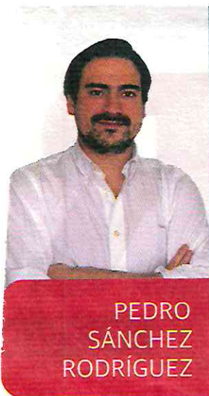
PEDRO SÁNCHEZ RODRÍGUEZ