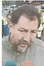
Gerardo Fernández Noroña

:::: Quien quiere montarse a la ola de la sucesión presidencial adelantada es el diputado federal petista, Gerardo Fernández Noroña . El vicecoordinador petista, y quien recientemente ganó la reelección para estar en la 65 Legislatura, ya anunció que no lo descarten porque él también va a buscar ser candidato presidencial del movimiento de la Cuarta Transformación. Curiosamente, son tantos ya los aspirantes oficialistas que más de uno