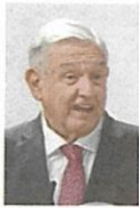
Andrés M. López Obrador

:::: Hay funcionarios a quienes ya les urge que termine la gira actual del presidente Andrés