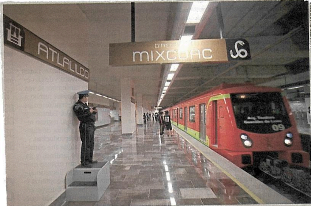
Pese al paso del tiempo, los nombres prehispánicos siguen acompañándonos en varios sitios de la capital y del país. Aquí la estación Atlalilco, dirección Mixcoac, de la Línea 12 del Metro.

Según el cronista, en este momento hay muchas generaciones —niños, jóvenes y adultos— con un genuino interés por conocer las raíces y orígenes de nuestra sociedad, que es vital para construir un futuro mejor. ●