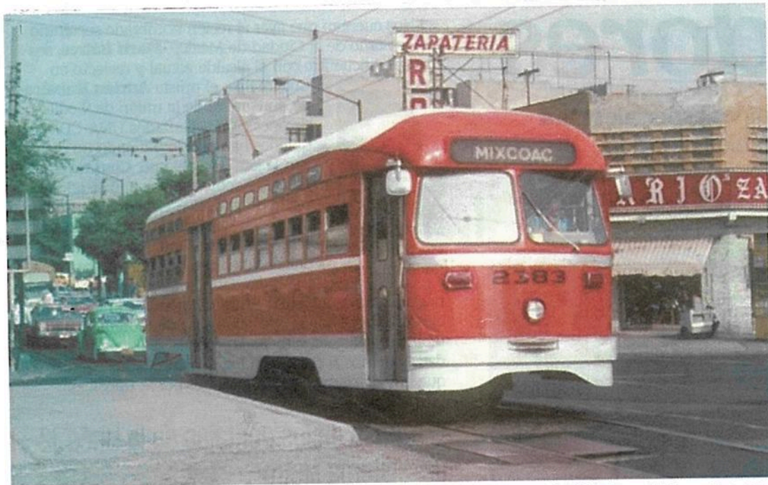
En esta imagen de los años 70 se ve un tranvía con destino a Mixcoac, que significa lugar de las nubes en forma de serpiente, en el cruce de la calzada de Tlalpan y Municipio Libre.

Por las conmemoraciones de Tenochtitlan, hoy recordamos palabras de origen prehispánico que aún están plasmadas en calles, colonias o estaciones del Metro de la capital, nombres ligados a la identidad de cada lugar