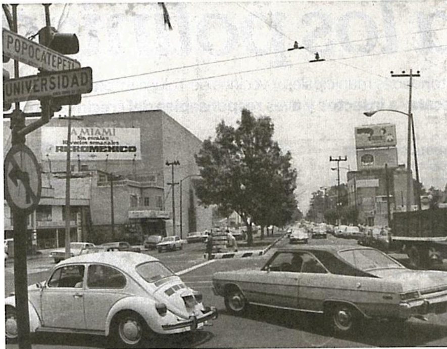
Popocatepetl en 1978 antes de ser Eje Vial. Se refiere al guerrero de la leyenda de los enamorados Iztaccíhuatl y Popocatepetl, como conocemos a la montaña y al volcán.