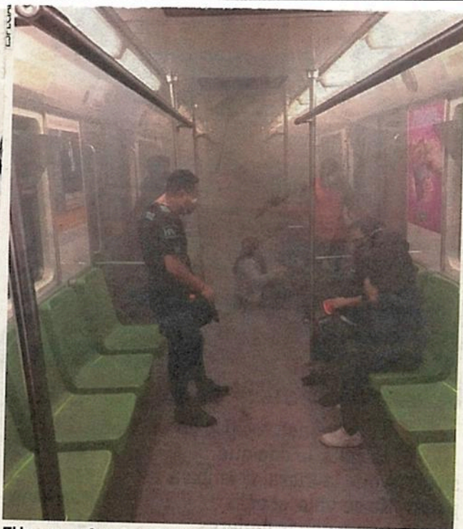
El humo sofocaba a los usuarios que estaban adentro.