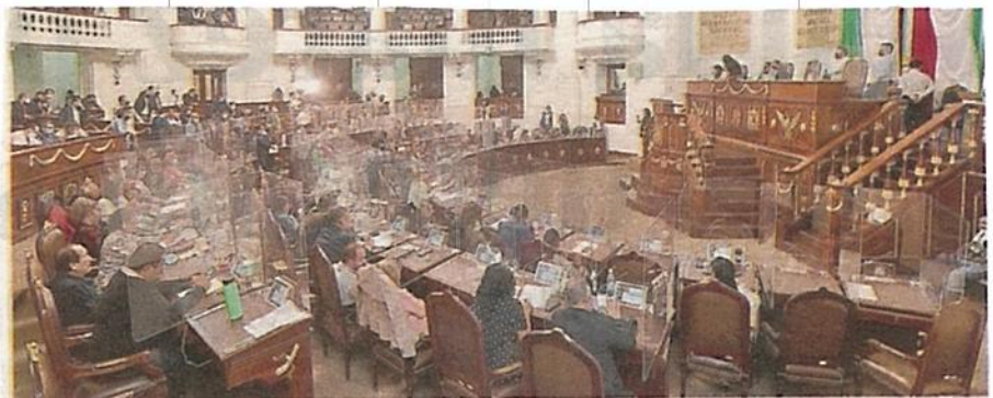
En sesión de madrugada, el Pleno de Donceles y Allende aprobó por unanimidad el acuerdo de la Jucopo