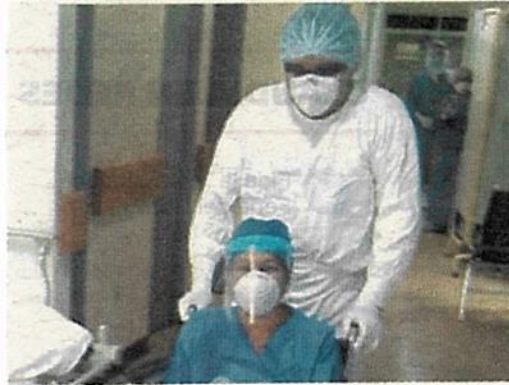
Cada vez menos contagios