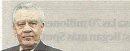
Lic. Mario Delgado, Presidente de Morena:

CIUDAD DE MÉXICO.- Después del derrumbe de la Línea 12, la afectación a Marcelo Ebrard y Claudia Sheinbaum era palpable, por lo que Andrés Manuel López Obrador se dedicó al control de daños estando a unas semanas de las elecciones intermedias. Minimizó el hecho ("estas cosas pasan") y ratificó las posibilidades de los interfectos para contender por la candidatura presidencial.