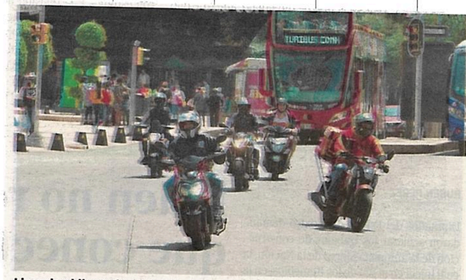
Licencia obligatoria para todos los motociclistas que conducen en la Ciudad de México