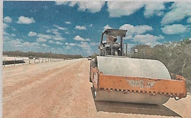
■ Un tractor permanece parado en la zona del tramo 5 del tren.

Es el segundo aplazamiento de la audiencia, originalmente programada para el 22 de abril. Con ello, sigue vigente la suspensión provisional otorgada por el juez el pasado 12 de abril, que tiene el siguiente efecto: