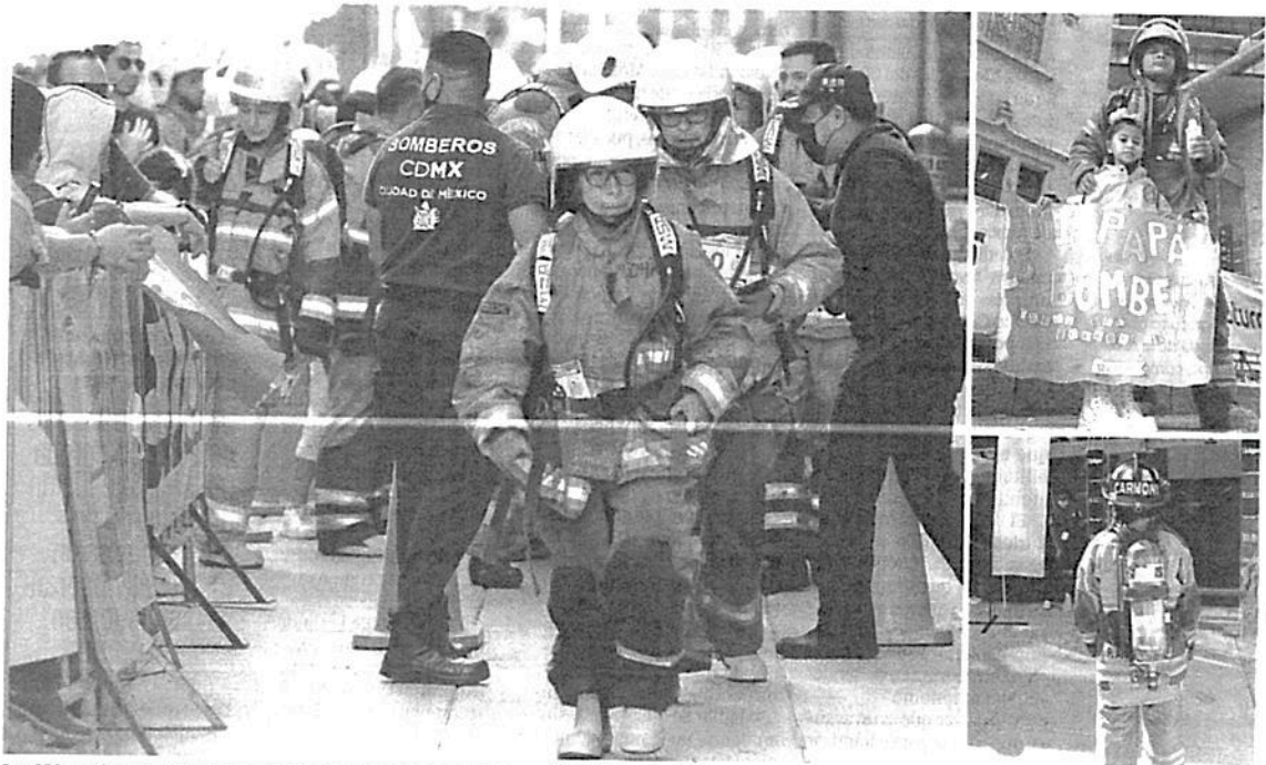
Los 250 participantes de la carrera se prepararon físicamente para subir 53 pisos de la Torre Reforma. Sus familias los animaban con carteles.

aproximadamente pesaba el equipo con el que los bomberos tenían que subir a la Torre Reforma.