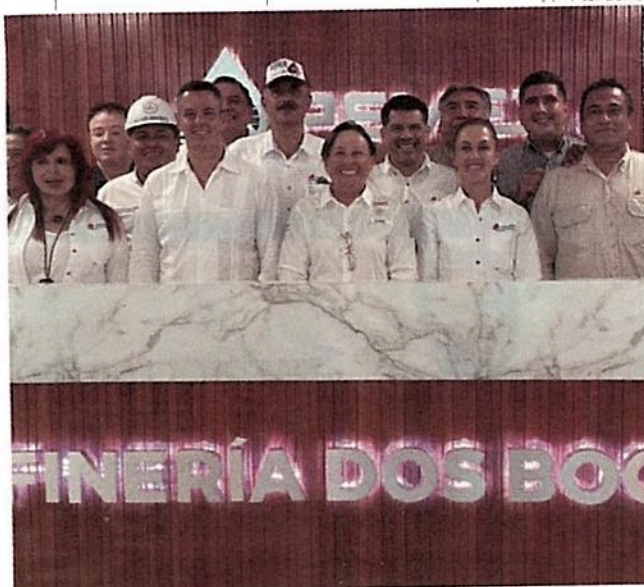
• OBRA. Claudia Sheinbaum, durante su recorrido por la Refinería Olmecca, de Dos Bocas, Tabasco.

La mandataria capitalina mostró en sus redes su encuentro con la Secretaria de Energía, Rocío Nahle y con los gobernadores de Oaxaca, Tabasco y Campeche, Alejandro Murat, Carlos Manuel Merino y Layda Sansores, respectivamente.