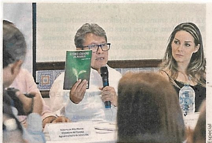
El senador Ricardo Monreal presentó el viernes su libro “Otro campo es posible” en Tepatitlán de Morelos, Jalisco.

Los planteamientos de la publicación están plasmados en una propuesta de Ley para un nuevo Código Agrario que, adelantó, espera su pronta aprobación.