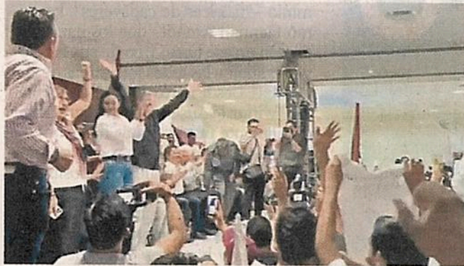
■ Al ser presentado en un mitin en Gómez Palacio, el Canciller Marcelo Ebrard recibió gritos de “¡Presidente!”.