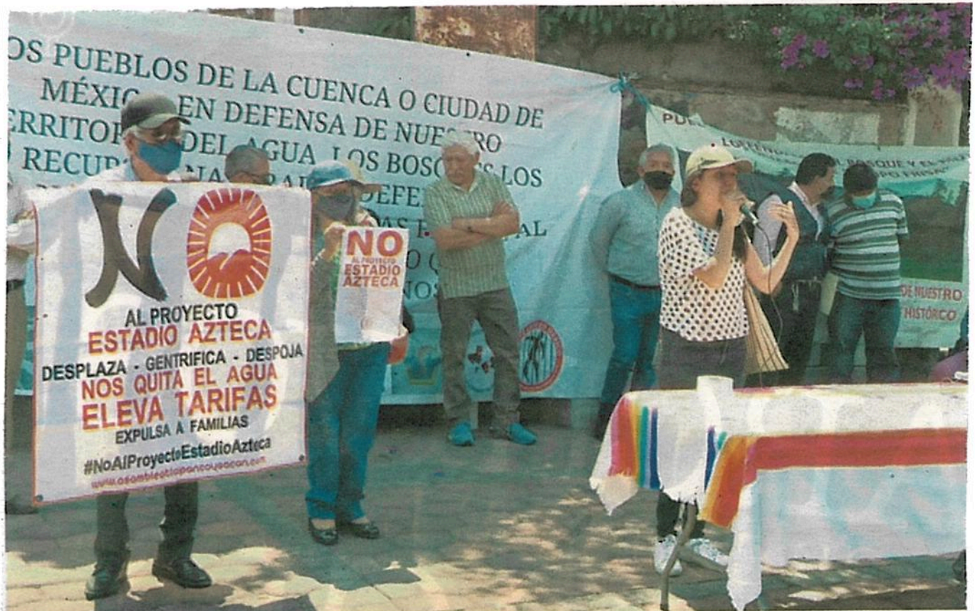
Residentes de barrios y pueblos se reunieron en San Jerónimo para presentar sus problemáticas