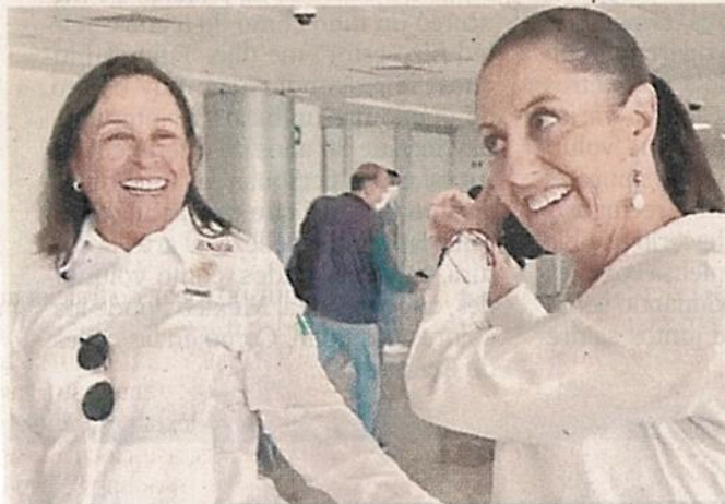
■ Rocío Nahle recibió a Claudia Sheinbaum con un abrazo en el aeropuerto de Villahermosa.

“Los volúmenes son muy altos, pero tuvo la audacia el Presidente de iniciar la obra inmediatamente, ahora ya no podríamos construir en este precio ni en este tiempo”, dijo Nahle.