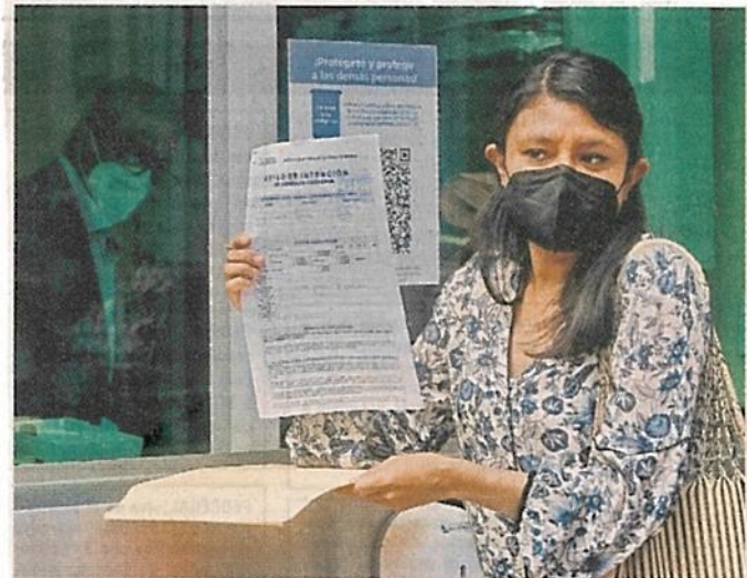
■ Solicitaron una nueva consulta para el proyecto.