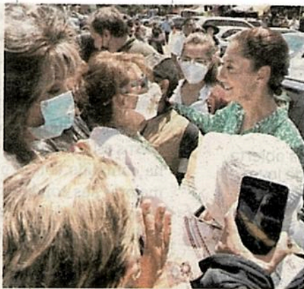
Con mujeres de su alcaldía, Tlalpan

También puede realizarse testamentos sin costo alguno.