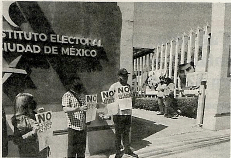
Exigen se pregunte a un kilómetro a la redonda

Habitantes afectados por el proyecto entregaron al IECDMX, el Aviso de Intención de Consulta Ciudadana