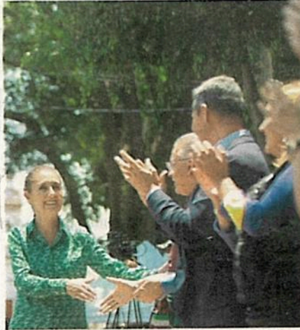
Sheinbaum Pardo visitó Tlalpan