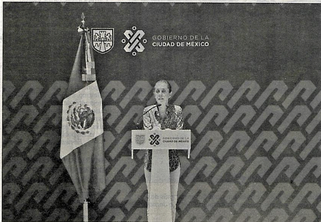
▲ Durante su recorrido por Tlalpan, la jefa de Gobierno hizo anuncios de apoyo económico.

Anuncia Sheinbaum jornadas del bienestar para llevar alimentos y servicios a zonas marginadas