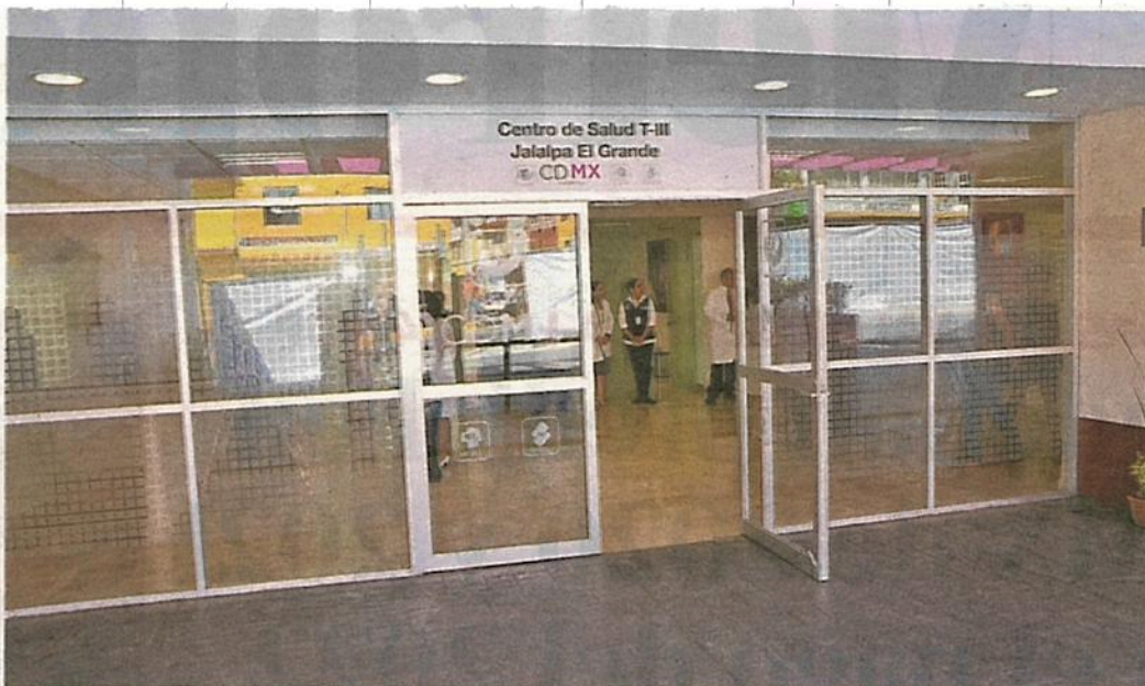
Centro de Salud T-III, Jalalpa El Grande