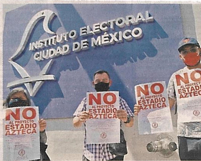
Colonos protestaron ayer en las oficinas del IECM.

por parte de la Jefa de Gobierno (Claudia Sheinbaum) para que se construya el Conjunto Estadio Azteca, en los predios en Circuito Estadio Azteca 42, Calzada de Tlalpan 3475, Periférico Sur 5682 y Prolongación División del Norte 3901", anotaron los vecinos en la respuesta.