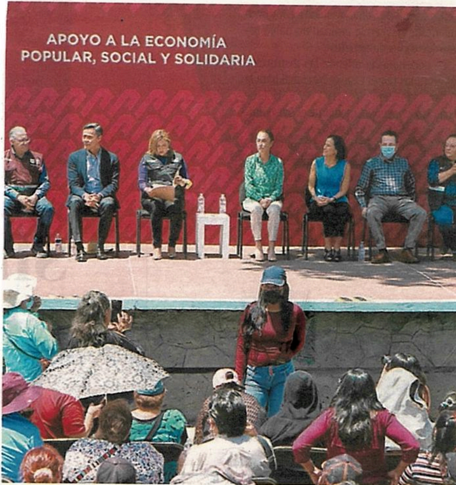
Claudia Sheinbaum anunció la condonación de deudas para las más de 80 mil familias capitalinas

sino "un asunto de apoyo a la economía familiar de los que menos tienen. O sea, estamos disminuyendo los ingresos en realidad, dado que no se pagan los recargos, las deudas", señaló.