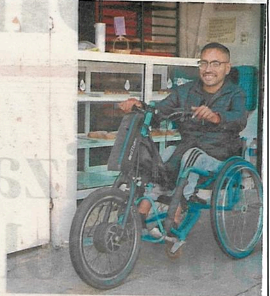
El gobierno de la CDMX iniciará un censo para ubicar a personas con discapacidad

“Y la pregunta es: ¿cómo hacemos todo eso?, ¿de dónde salen tantos recursos para apoyar a la gente —porque lo mejor que se puede hacer en este momento es el apoyo directo—? Pues los recursos sencillamente salen del modelo que tiene el Presidente y que aplicamos aquí en la ciudad, que se llama Austeridad Republicana, que es: acabar con la corrupción, aca-