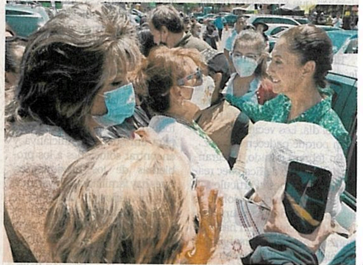
En un evento en Tlalpan, la jefa de Gobierno expuso que se extiende el descuento en el predial para adultos mayores.

Dijo que como parte de las acciones de apoyo a la economía familiar, se adelantó el acceso a la cuota fija o a 30% de descuento en pago de predial para personas de 58 años y más, cuyos inmue-