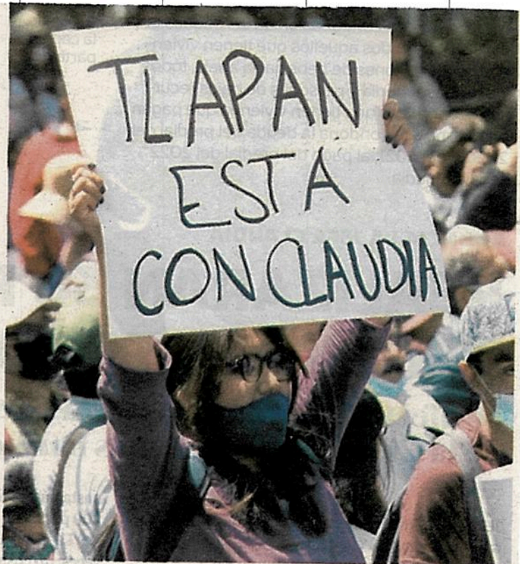
La ciudadanía mantiene cercanía con la Jefa Claudia

Gestores sociales del gobierno capitalino recogían las quejas y peticiones ignoradas por Alfa