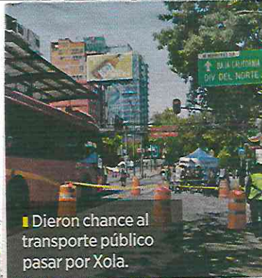
■ Dieron chance al transporte público pasar por Xola.

“Hacer un pacto ciudadano por el agua, un pacto ciudadano que nos permita resolver el problema, que trascienda la política”, planteó Ballesteros en el parque Alfonso XIII de la alcaldía Álvaro Obregón.