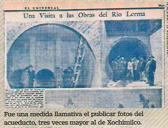
Fue una medida llamativa el publicar fotos del acueducto, tres veces mayor al de Xochimilco.