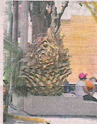
■ Vecinos han urgido la remoción de palmas.

En las Lomas de Chapultepec, en avenidas como