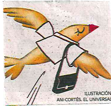
ILUSTRACIÓN: ANI-CORTÉS. EL UNIVERSAL

La capital expulsó a 385 mil 500 personas en la última década, reporta el Infonavit; ahora los mexicanos migran a ciudades como Querétaro, Hermosillo o Playa del Carmen en busca de mejores empleos