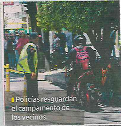
■ Policías resguardan el campamento de los vecinos.