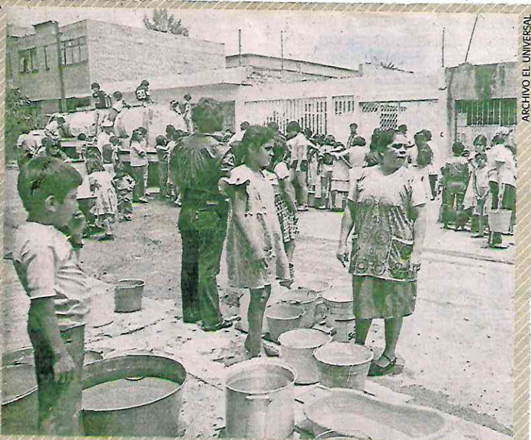
Los años 40 fueron una época en que la mayoría de la población del DF vivió con el mínimo de agua, en espera de la solución que sólo tardaba.

Sin embargo, a finales de la década de 1930 desde Tacubaya y la Del Valle, hasta La Villa, reportaban falta de agua.