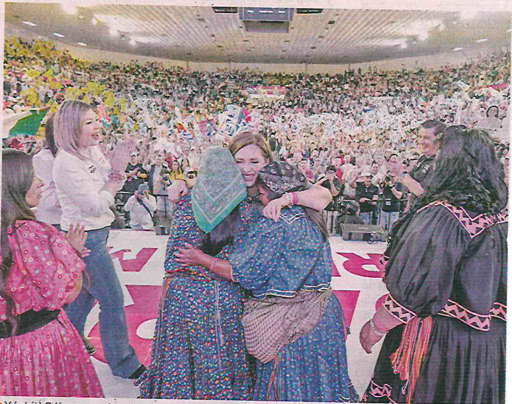
■ Xóchitl Gálvez encabezó ayer un mitin en el Gimnasio Universitario de Ciudad Juárez, Chihuahua, donde fue acompañada por un grupo de mujeres rarámuris.