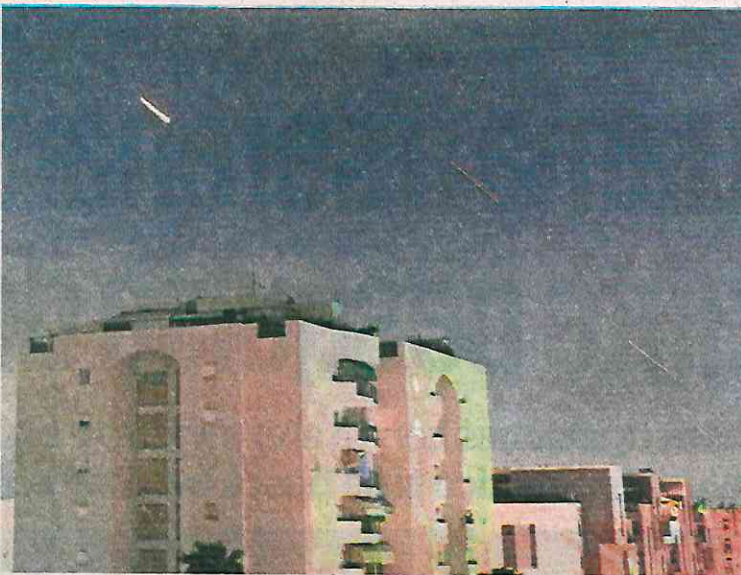
El sistema de defensa aérea israelí Domo de Hierro es activado para interceptar misiles disparados desde Irán.