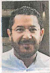
Martí Batres Guadarrama

ESPECIAL 12ME :::: En la víspera de la celebración por el 10 de mayo, Día de las Madres, quien se puso muy acorde fue el secretario de Gobierno de la