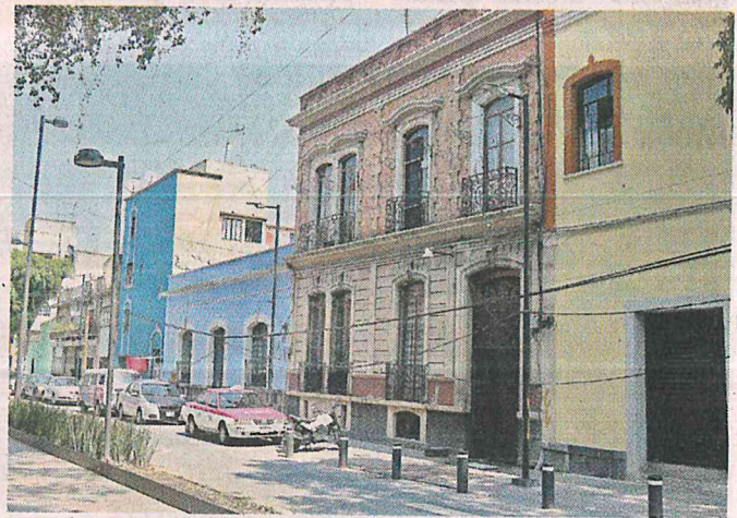
La Colonia Guerrero se estableció en 1870 y ha experimentado diversas transformaciones a través de los años.