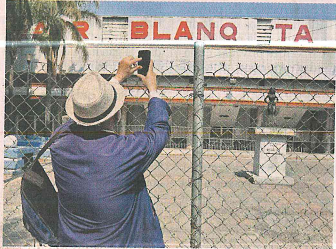
La marquesina del Teatro Blancaforta, símbolo del abandono en el que está el establecimiento desde 2015.

El punto de inicio fue la Parroquia de la Santa Vera Cruz. De ahí, el grupo llegó a la Subestación Eléctrica de la Guerrero, que abasteció de energía al tranvía y